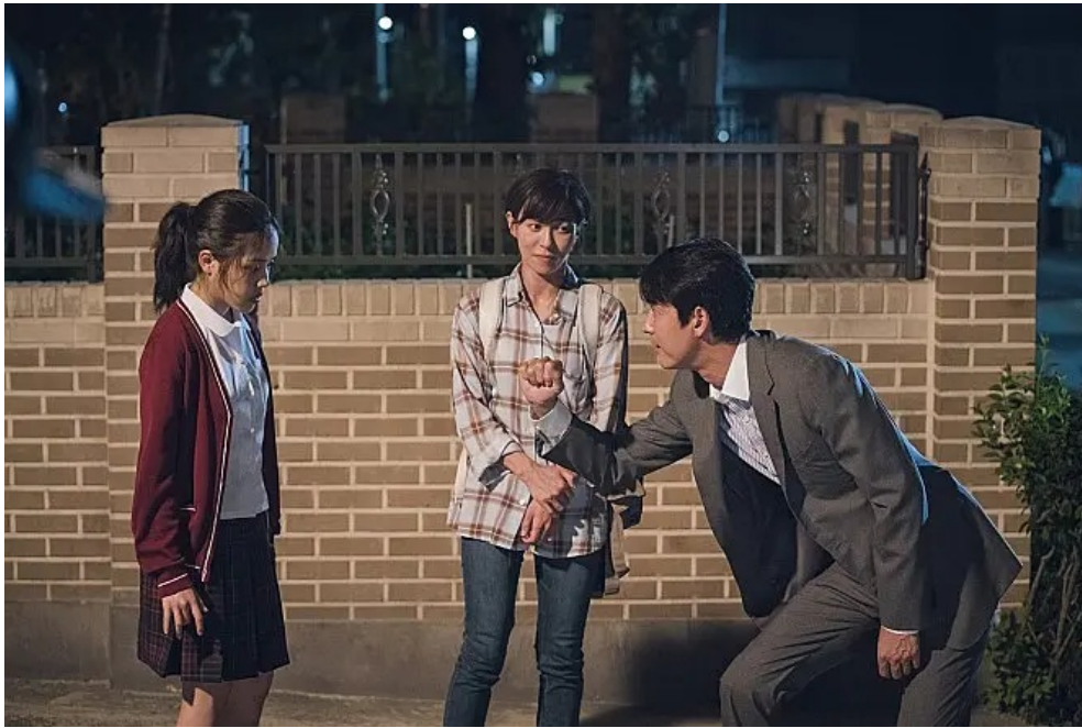
楊淳鎬不停學習與林智友溝通的方法。

電影中可以發現，辯護律師楊淳鎬嘗試在短時間之內取得智友的信任，此過程卻花費了電影一半以上的時間。