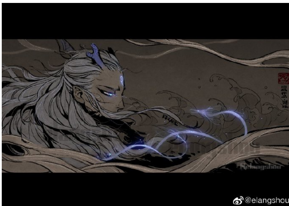
東海龍宮三太子敖丙

不管各自身上被貼著多少的標籤。哪吒和敖丙兩個角色的人設，是電影對原著改編最為精采之處，導演特別以現代社會留守兒童和望子成龍的社會現象為原型，引起華人社會的我們內心的共鳴。