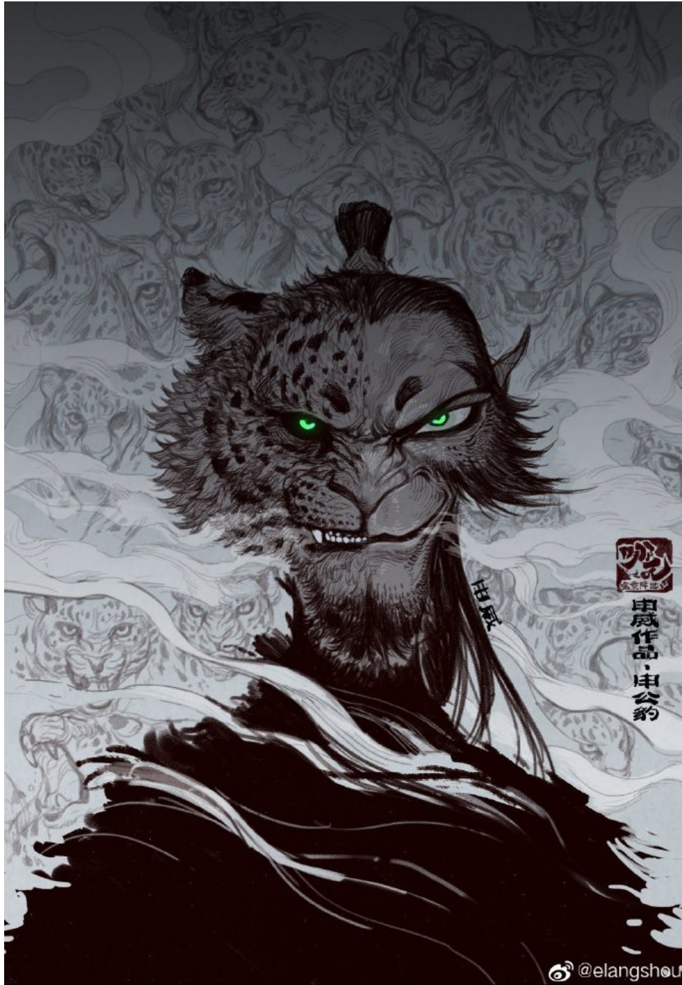
說話結巴的申公豹

哪吒生性純侯，但因其身為魔丸，出生便身負必死的命，下口又身化有弑父除害無空陪伴，再加上周圍人的偏見，性格變得玩世不恭，但內心仍然渴望得到尊重與認可。相較於哪吒大咧咧的形象，敖丙則是感情細膩、出生便背負復興龍族的使命，從小對父言聽計，沒有自己的立場。而相比兩位年輕人英勇闖關的熱血故事，申公豹才是我覺得最令人疼惜的角色。