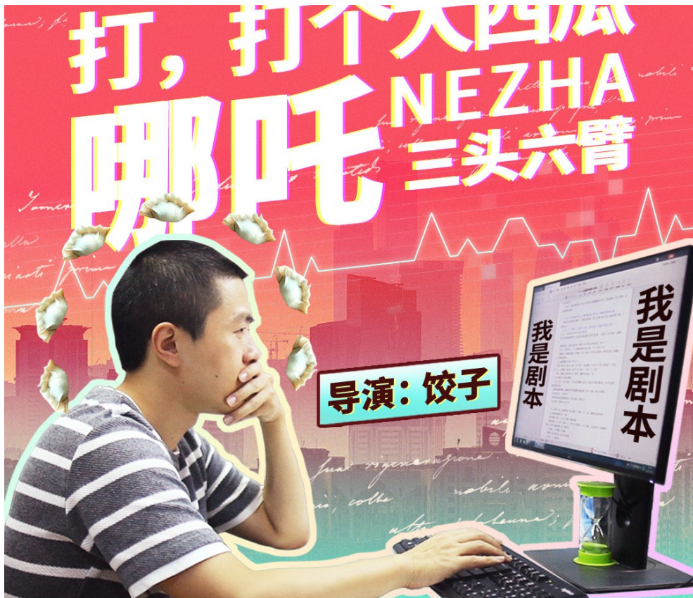
三頭六臂一人多職的導演餃子