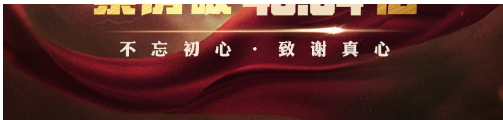
《哪吒》中國影史票房亞軍海報

《哪吒之魔童轉世》（以下簡稱哪吒）票房49.72億人民幣（約215億台幣），創下中國內地票房最高的動畫電影，中國影視票房亞軍的成就。2019年，註定在中國電影史上留下濃墨重彩的一筆。