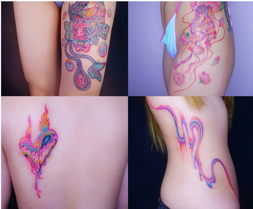
EDNA的水彩刺青作品。