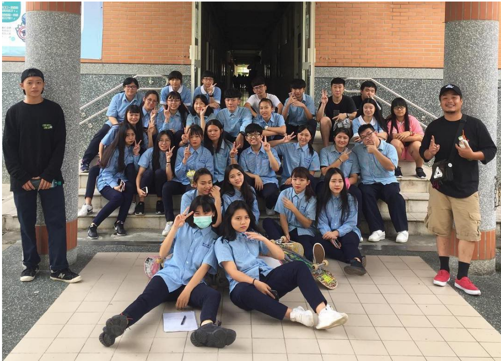
橘哥與聖母專校滑板社合作。