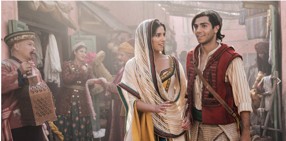
三人尋找自我價值的一段旅程。

不論是阿拉丁、茉莉公主或是精靈，這三個角色在整部電影都有很重要的改變與成長，其中又以茉莉公主最為顯著。然而儘管淡化了童話故事的不真實感，這部電影也不失原本動畫的神秘奇幻感。