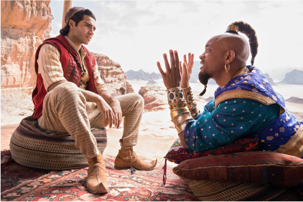
因為市井小民的身份而感到自卑的阿拉丁。

而另一個很可惜的角色就是反派賈方，這個角色在電影中的改編有好有壞。其中我很喜歡電影為賈方加入的新人物設定，也就是他曾經也和阿拉丁一樣是人人喊打的市井小賊。這樣的設定不僅讓他對國家的野心合理化，不再是為反而反，也同樣讓他更為立體。「偷一顆蘋果，你就只是個小偷。偷走一座王國，你就是國王。」這句台詞更是電影中的經典。