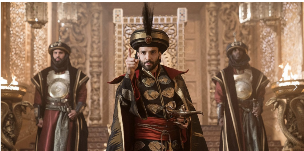
反派魅力稍嫌不足是《阿拉丁》可惜的地方。

然而電影中賈方的戲份卻非常稀少，真正與正方打鬥的片段幾乎是很快就結束，讓觀眾感覺反派好像才沒出場多久，就很弱地領便當了。再加上演繹出的邪惡感不足，讓賈方這個本該很有張力的反派一下子變得很虛。