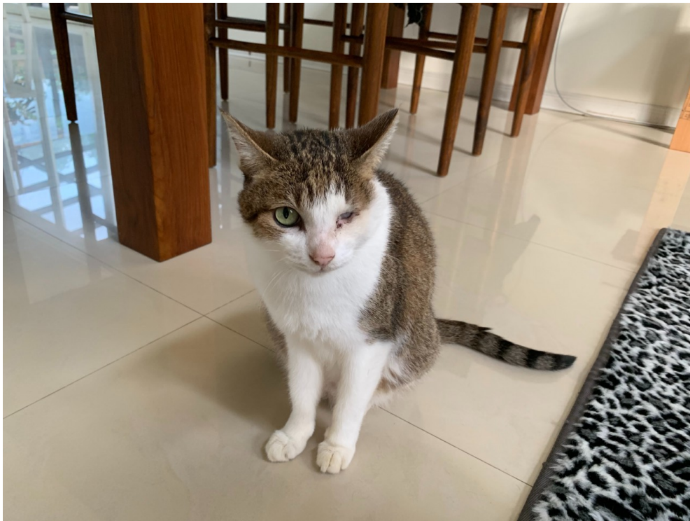
Carol家中親人的小貓咪——單單。

Carol的家，位於新北市的郊區，被一片綠意包圍。門前的庭院裡，有著幾個紙箱，是爲了每天都會來這吃飯的幾隻貓咪準備的，雖是「浪浪」，但Carol早就把他們視爲自己家中的一份子。