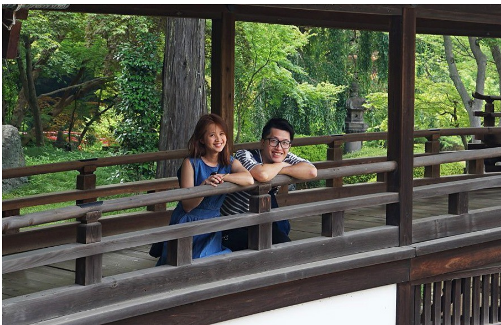
馬修與太太的合照。

日本電影《我與妻子的1778個故事》中，一位婦女因罹患癌症末期，被醫生告知只剩下一年壽命，卻因為丈夫每天為她寫下一則短篇小說，意外延長了1778天（將近五年）的壽命。