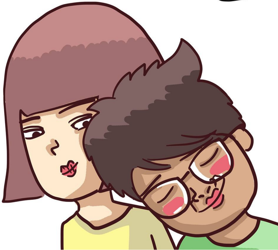
2014年的「太太先生」。

提起馬修的創作之路，他坦言一切都是「順其自然」。一開始的畫風隨意，人物特徵也不如現在有固定的髮型、穿著、總是露出Q彈的肚子，之後受到親友的鼓勵，決定創立Facebook粉絲專頁，才確立了畫風。馬修：「以前想到什麼就畫什麼，後來覺得角色需要比較明確的特色，才有辦法讓人辨識。」