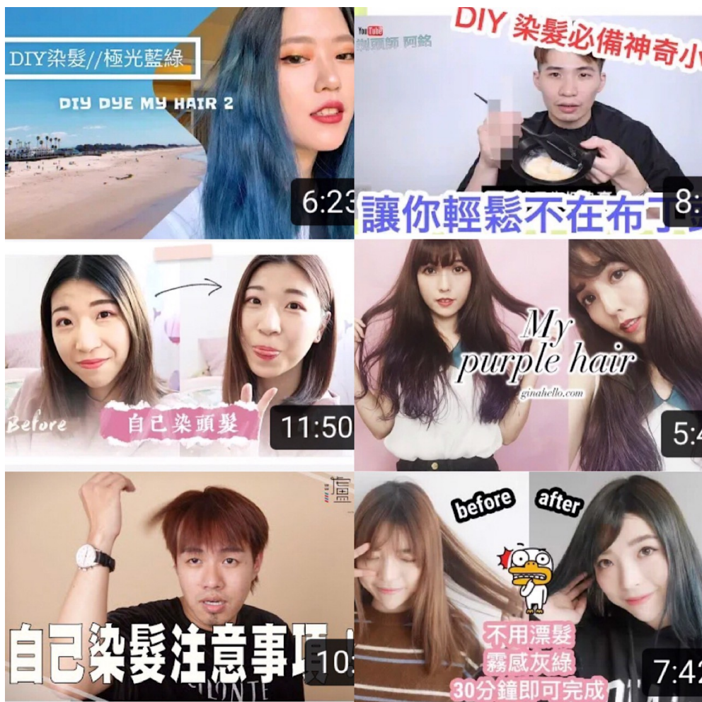
許多YouTuber介紹DIY染髮。(圖片來源 / 陳忻瑜製) 資料來源： YouTube

網路時代的興起，造成行銷市場上的改變，開架染劑過去給我們「顏色單一」、「為了遮白髮」才會選擇使用的印象。如果想要擁有更特殊、夢幻的髮色，開架染劑就很難達成。然而，透過「網紅經濟」的影響力，讓它的形象翻新，與流行搭上邊。網紅媒合行銷企劃平台KoIRadar指出，一般消費者會透過其他消費者的分享照做為參考，增加購買慾望。網紅也常將產品以貼近生活場景的方式，與粉絲分享自己使用的產品。靠著平日與粉絲累積的互動與信任感，有效增加購買的說服力，單純的分享就能「燒」到粉絲，使消費者無意間獲取該產品的資訊，對品牌產生興趣。更不用說當網紅與企業長期合作，不時將產品的「好」灌輸給粉絲，間接提升消費者對品牌的好感度。