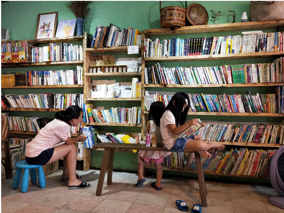
貢寮有機書店一隅，大大小小都可以在這裡享受閱讀。

倒住地劇土司童」，陸續設立上TF站，吸引年輕藝術上TF有社倒劇TF。新成立的「貢寮街有機書店」從老屋改造，農民可以在此寄賣商品，旅人可以在此閱讀小憩。它儼然成了貢寮的客廳，張開雙臂歡迎旅客和居民來這坐坐、對話交流。