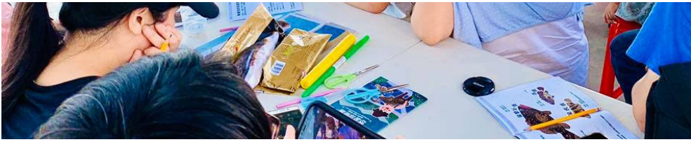
大小港邊 熱帶漁林舉辦的實體活動。

地方創生計畫立意良善，民間也正將它執行地有聲有色。然而鄉鎮在發展時要懂得平衡，切莫一下子湧入太多觀光客使其變得「墾丁化」而失去原有的初衷。同時也望民眾在遊玩的時候秉持著「認識而不打擾」的原則，尊重當地居民的生活。無論都市或是鄉村，都是台灣的一部分，都是我們的家。盼大家都能深刻的認識這片養育我們的土地，用愛創造文化以回饋它，並腳踏實地，好好地在此生活著。