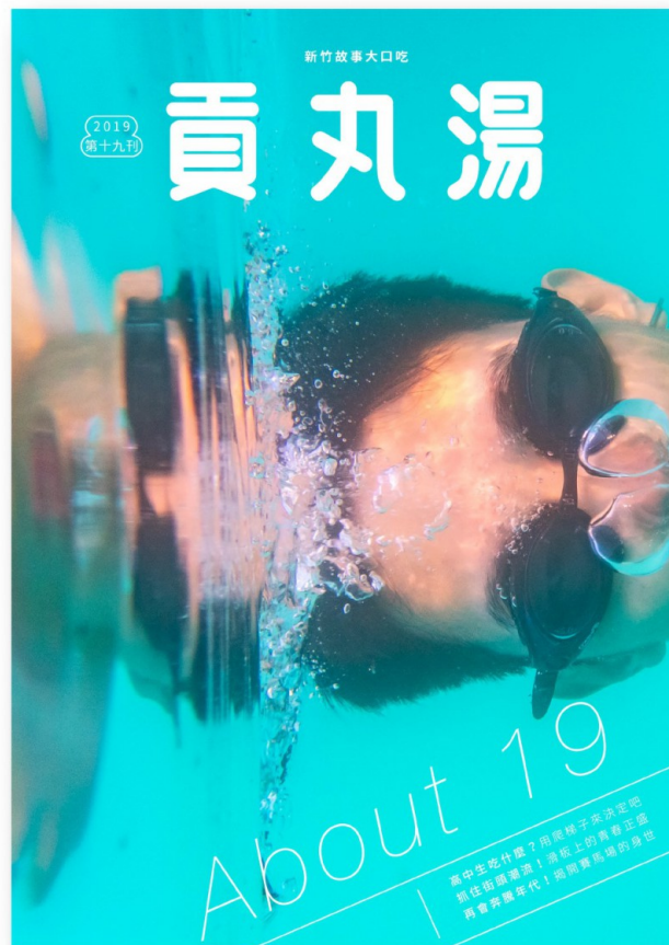
第十九期《貢丸湯》封面。

由一群畢業於國立清華大學的學生所成立的「見域Citilens」，旨在推動新竹舊城區的活化，讓新竹老城能被更多人看見。《貢丸湯》為其獨立發行的地方雜誌，內容刊載了新竹的文化和故事。這本雜誌不單單以「單點式」來介紹新竹，而是從主題和區域的方式更全面的帶出新竹的種種議題，讓民眾閱讀完就像體驗了一番新竹的生活。此外，團隊也開設不同主題的城市導覽，更常與新竹市政府、新竹生活美學館及在地商家合作，規劃各式活動，如營隊、講座、展覽等。透過這些實體活動把新竹舊城區的城門打開，邀請民眾一同來探索這個地方。