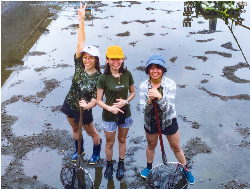
現在愈來愈多年輕人願意返鄉工作。

近年來走進鄉村，除了一些較年邁的在地居民，我們更不時會看到一些年輕的面孔，有的戴起斗笠拿著鋤頭在田間工作，有的駐村創作藝術，有的在翻修後的老屋裡創業等等。與其待在都市闖蕩，回到家鄉打拼似乎成了這一代的流行。現在的年輕人很多都選擇回家，摸索著自己的家鄉能創造出什麼新的生機。