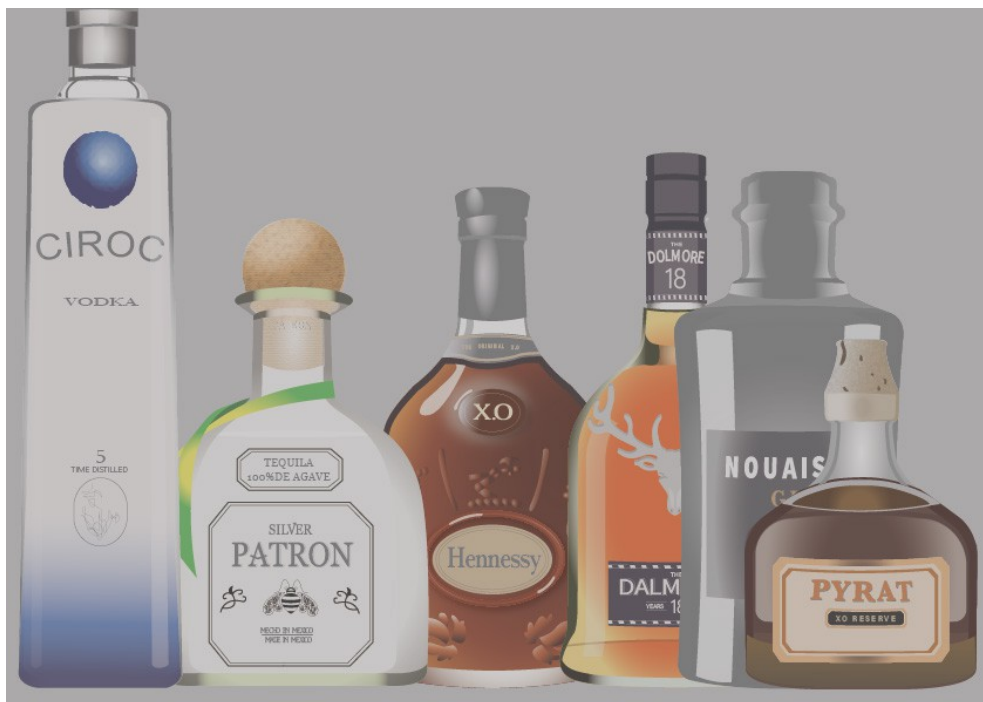
( 圖片來源 / 吳宥芯製 ) 資料來源：調酒師陳俊光

點擊下圖可連結網頁，有關調酒製作與歷史，並講述正確的品嚐方式與觀念，撕除大眾對於酒精的負面既定印象。