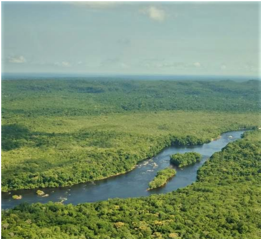
亞馬遜雨林被喻為地球之肺。

《BioScience》發表研究，重申2017年的氣候警告，並提出具體改善氣候方針，希望讓科學撼動政治意識，呼籲各領導人放棄盲目追求GDP成長，加速實踐「無碳經濟」。科學家也盼社會大眾更落實低碳生活，少吃家禽肉類、少用冷煤，並重視生態保育。而人口過度擴張也是造成高碳排的重要原因，地球人口成長率分布極度不均，開發中國家人口暴漲，已開發國家卻面臨少子化、高齡化。如何降低全球人口老化，並有系統地達到人口負成長，也將成為未來重要課題。