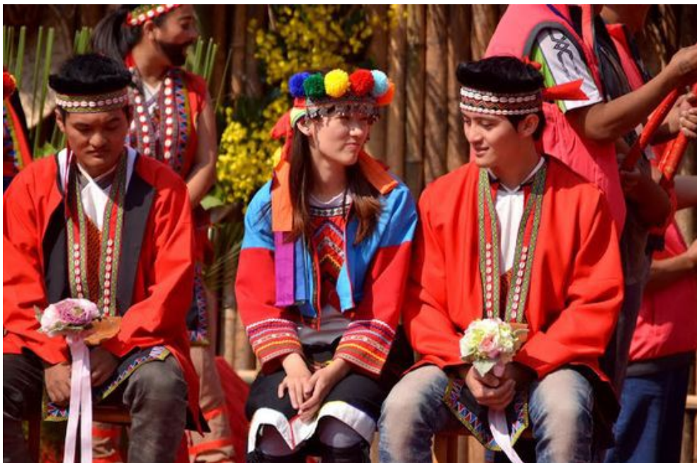
新生代都市原住民屬於第二代家庭。

轉眼五十年過去了，現在都市中存在著一群低調，卻留著獨特血液的年輕人，出生於千禧年間以及年後，他們是新生代的都市原住民。原住民居住於都市的原因繁多，包括就學、就業等，而新生代都市原住民大多屬於第二代家庭，也就是其父母親於六十年代由原鄉遷至都市生活後，選擇留在都市並且生下兒女，使孩童於都市受教育、生活等。