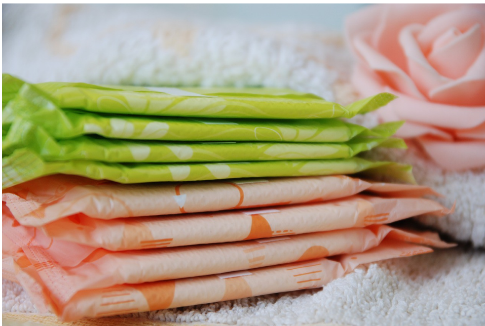
衛生棉是台灣女性最常使用的生理用品。

而衛生棉的材質部分是由塑膠以及無法回收的物質所組成，一片衛生棉所含的塑膠量，最高可以等於4個塑膠袋。且為了衛生考量，通常衛生棉外還有一層層的包裝，不論是從垃圾量或是材質的面向來看，衛生棉對環境造成的傷害都極大。因此近年來許多業者開始推出諸如月亮杯、布衛生棉以及經血褲等環保商品。