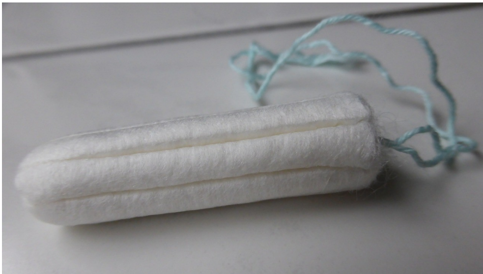
衛生棉條在台使用率低，商品選擇相對也較少。

民眾對於侵入式生理用品的恐懼，除了因為亞洲社會普遍較為保守外，對於這類生理用品認知不高或是認知錯誤，更是直接導致民眾抵觸心理的主要原因。