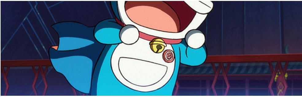
哆啦A夢反駁反派片段截圖。

這句話的前半部反駁了反派「想像遭致毀壞」的觀點，想像力本身並不遭來破壞，引發破壞的是不對他人關懷的心。一如反派以破壞之神自居，到處破壞只為滿足自我；而後半部點出這部電影的中心思想：想像力對於文明進步的重要性，如果人類放棄想像，那絕對是在我們朝進步路上的重重一擊。不去構想和憧憬，便不會產生目標，進而失去動力，將會對我們的未來產生更大的破壞。