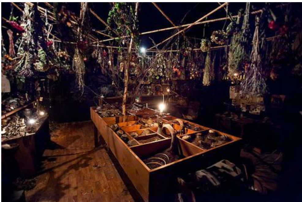
《不眠之夜》劇中場景之一。

整部劇奪人眼球的，除了特殊的演出方式與演員精湛的演技之外，劇場的設定絕對也是亮點之一。坐落在紐約雀兒喜區27街上，一個廢棄五層樓高的倉庫被佈置成一間受詛咒的飯店「Mckittrick Hotel」。整間飯店擁有超過一百間房間，每一間房間的裝潢都是獨一無二的，有毛骨悚然的精神病院、陰森的墓地、琳瑯滿目的糖果店與馬克白夫婦的臥室。從傢俱的擺設與場景的佈置，就能感覺到此劇團對於細節的講究，彷彿真的走入了1920年代的歐洲。