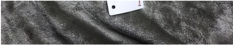
幫助觀眾推理劇情的手寫信件。

雖然這種朦朧不清的感覺令我非常困擾，但如果劇情過於明朗，似乎就會少了一些投入感，進而缺少找出真相的動力。為了蒐集線索，我跟著不同的演員在整個劇場上上下下跑了好幾回，體力與腦力雖透支得差不多，卻也獲得滿滿的成就感。