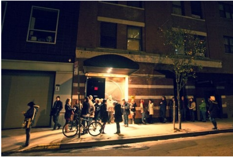
看似平凡無奇的飯店外觀。

從踏進飯店的那一刻起，我就能感受到滿滿的驚悚的元素。現場細膩、精準的場景佈置及配樂讓人在毛骨悚然之際，馬上被好奇心所驅使，跟著演員一起進入馬克白筆下爾虞我詐、利慾薰心的世界，我想這大概也就是整部劇最迷人的地方。