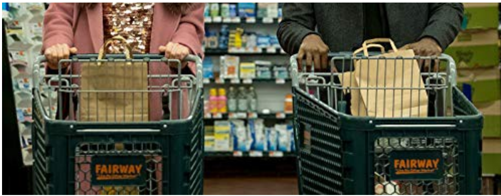
未發病時閃亮動人的萊西。