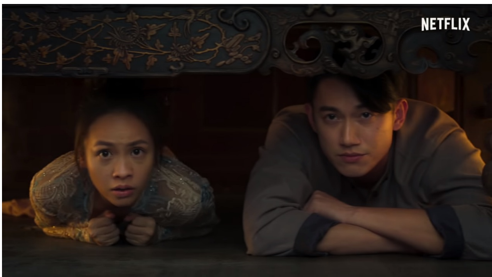
麗蘭和二朗的初次相遇是在天青的床底下。

在面對家裡的負債以及父親的瀕危，麗蘭並沒有直接順從權貴林家提出的「冥婚」要求。為了尋找可以作為等價交易的條件，她踏上了揭開富家少爺林天青（田士廣飾）死亡謎團之路。在過程中，她結交了天庭守衛——二郎（吳慷仁飾），二人從冤家變成伙伴。在關鍵時刻，可以看到麗蘭的機智與勇敢，不僅幫自己脫離險境，更是能夠助夥伴一臂之力，不只是個等待被英雄救美的女主角。到故事的最後，她甚至放棄嫁給斯文又多金的白馬王子林天白（林路迪飾），選擇跟著二郎繼續去各地冒險。