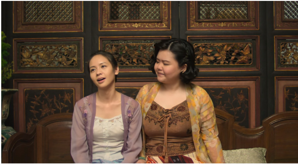
麗蘭和閨蜜談心，被問到心上人時想要迴避。

不認為自己也應該走在同一條路上。雖然不會刺繡，但並不代表她不懂大家閨秀的禮儀；雖然她不懂得打理家務，卻拯救了自己的家。對於一個生活在舊時代的女性看來，我看到了她思考獨立且勇於冒險的一面。