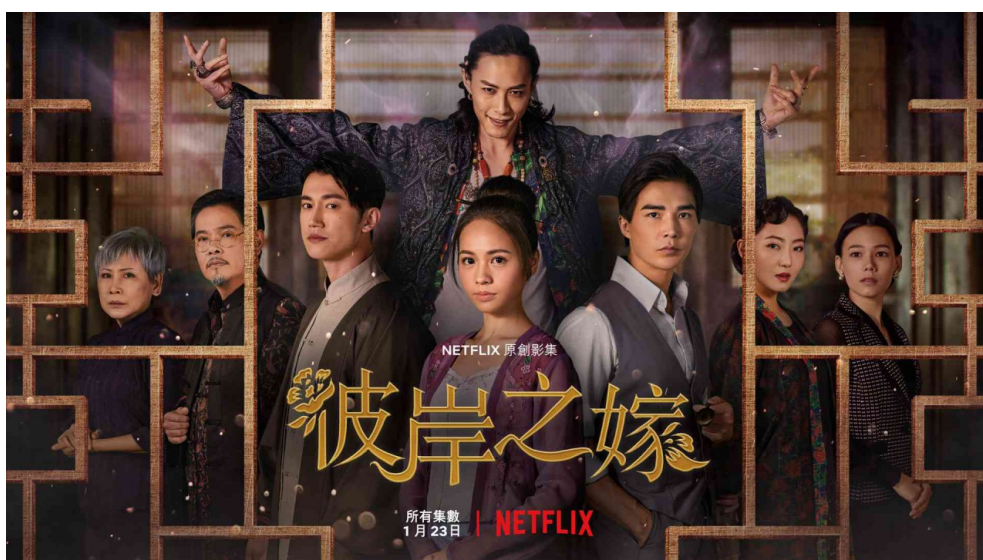
《彼岸之嫁》裡來自台灣、馬來西亞與加拿大的一眾演員。

Netflix華語自製原創影集《彼岸之嫁》在2020年年初開播，這是一部由台灣與馬來西亞團隊聯合製作的奇幻懸疑劇。劇本改編自旅美華裔作家朱洋熹的小說《鬼新娘》，小說在美國出版時大獲好評，更是被著名脫口秀主持人——歐普拉溫芙蕾（Oprah Winfrey）推薦為值得一看的好書。作為Netflix第三部華語影集，以「冥婚」及濃厚的南洋華人色彩為主題，加上來自世界各地的知名演員，讓這部劇在未開播前就話題滿滿。