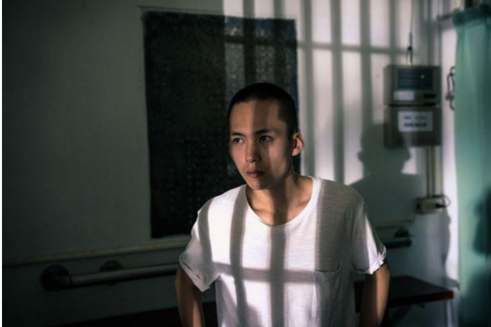
本部片有許多運用光影構圖的元素。

弟弟阿和不是一個很會讀書的人，在臺灣社會中，這樣的孩子多數並不是在祝福之中長大，尤其阿和還有一個模範哥哥阿豪，相比之下，阿和顯得「無路用」。若在一个傳統保守的環境之中成長，家裡持有「唯有讀書高」的思想，那這樣的孩子肯定是不被祝福的。