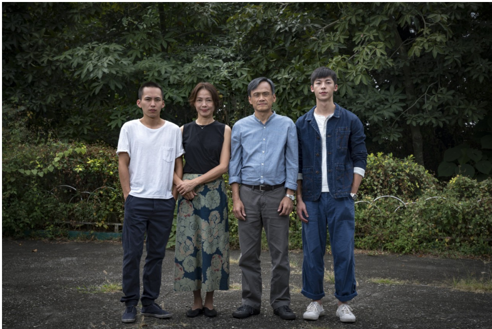
由左至右為阿和、琴姊、阿文及阿豪。

陽光普照是導演鍾孟宏所執導的第五部劇情長片，在第56屆金馬獎共入圍十一項，並獲得六項大獎，包含最佳劇情長片、最佳導演、最佳男主角、男配角獎等。