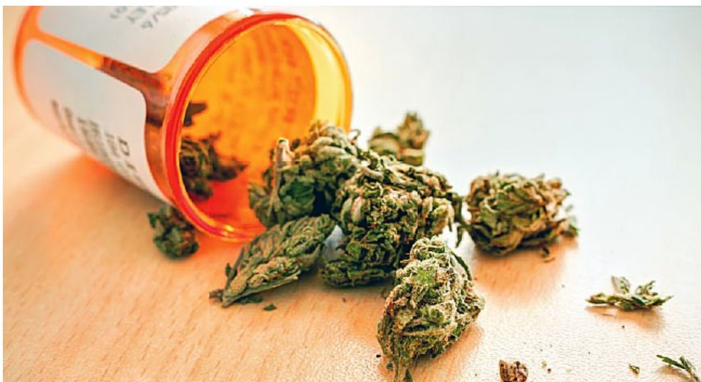
醫療用大麻。

娛樂用大麻最符合一般人對於大麻的想像，也就是在阿姆斯特丹街頭的咖啡店（Coffee Shop）裡人手一支在吞雲吐霧的形象。許多娛樂用大麻的使用者，也就是俗稱的「飛行員」，會為了體驗飛得更高（更嗨）而追求THC比例更高，CBD比例更低的品種。醫療用大麻是最常出現合法爭議的領域，通常為含有較低THC以及較高CBD的品種，在臨床實驗上已經證實能夠用於治療非常多不同種類的疾病，包含常聽聞的精神疾病以及疼痛的紓解，甚至對老年癡呆及癌症也有療效。而工業用大麻的用途則非常廣，其中有部分功能與醫療用大麻重疊，基本上只要THC的含量小於0.3%，就能被稱為工業用大麻。除了其纖維能夠拿來製造多項紡織品之外，食品工業也是它能發揮的領域。此外，工業大麻還有一個獨立的名稱「Hemp」。