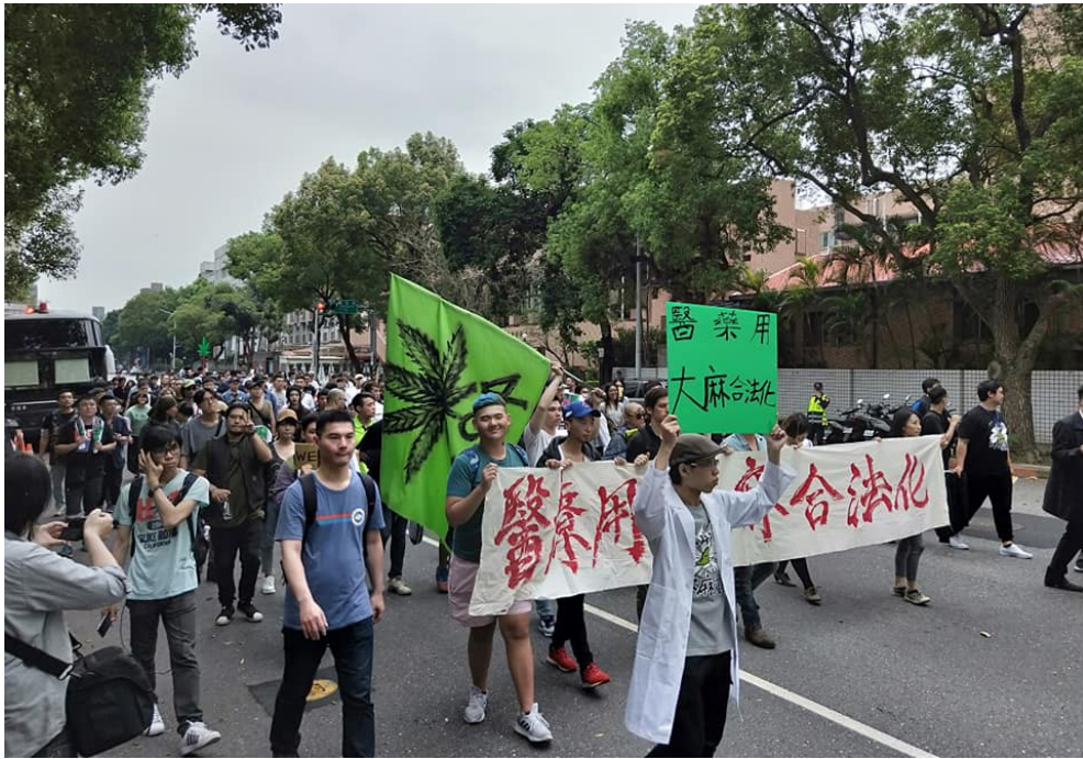
420遊行現場。