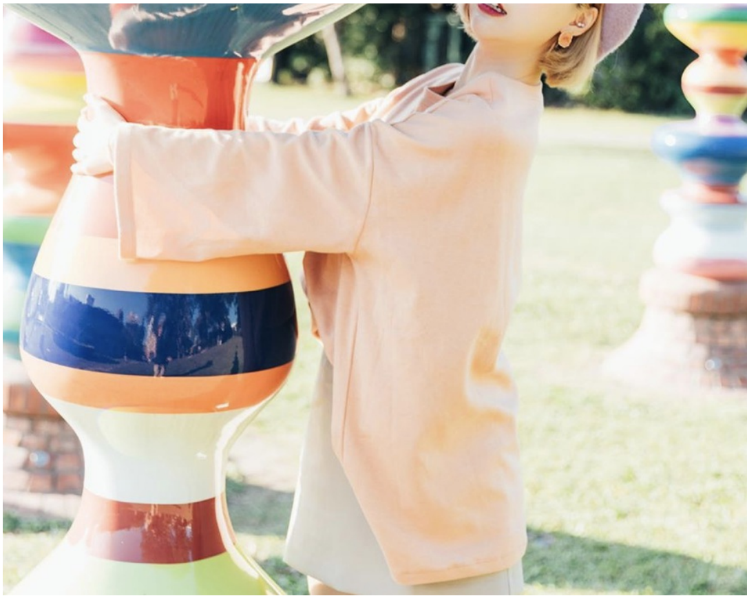
鬼靈精怪的阿圓，總是展現最真實的自己。

從隻身北漂，成為一個平凡的上班族，到放棄平穩日子，飛去韓國唸書。這個女孩，身體流著不甘平凡的血液，儘管前途未卜，對熱愛冒險的她而言，再困難的事情，都是其次。這種敢想、敢衝的個性，大概是對序列有秩的生活，發出無聲的抗議。