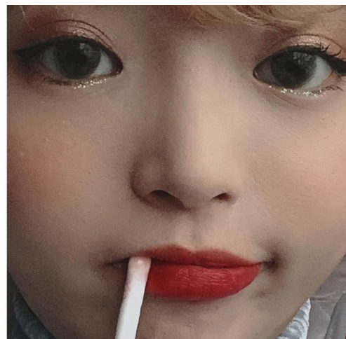
對她來說，性感就是認同自己的一切。

身材姣好的她，今天穿無袖背心，可能就會有人拿她胸部開話題、作文章。她也曾思考過，是不是胸部變小，別人就不會再那麼針對。但現在，她肯定的說，只要認同自己就是最好的，所以，縱使攻擊的聲音不滅，她也不會因此改變一貫的作風，「因為我就是喜歡現在的我啊！」