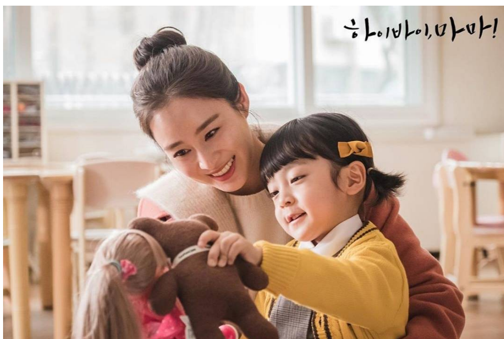
復活後的瑜理與棲环。

劇情描述一位新手媽媽車瑜理 ( 金泰希飾 ) 在一次意外中身亡，留下剛出生的孩子曹棲环 ( 徐宇真飾 ) 和丈夫曹剛和 ( 李奎炯飾 )，放不下摯愛家人的瑜理，變成鬼魂後每天在家人身邊遊蕩，因此讓年幼的棲环看的見鬼魂。這一切讓瑜理覺得上天不公平，於是頂撞上天，而上天為了處罰瑜理，將她的審判移到陽間進行，便讓她死而復生，但必須在49天之內找回自己死亡前的身分，屆時便能選擇重新投胎成人。