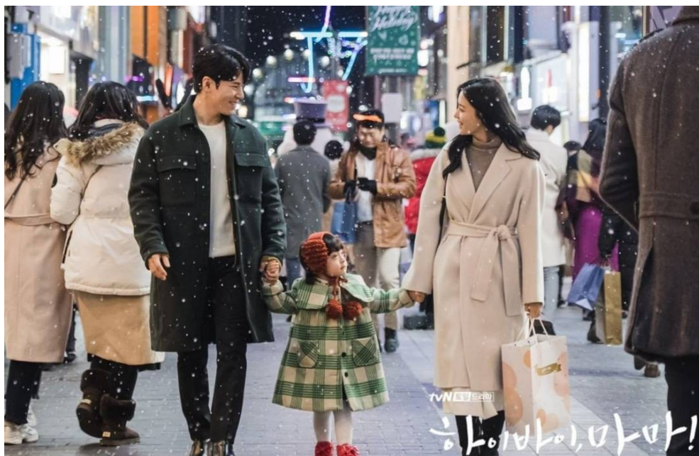
再婚後的剛和一家。

另一位媽媽是棲玧的繼母吳珉貞（高甫潔飾），學生時期即暗戀剛和的她，在瑜理過世後與剛和結婚，卻發現婚姻生活與她的想像不符，心生離婚的想法。儘管婚姻並不美滿，但對棲玧的關懷是真心的，會因為棲玧可愛的舉動而感到窩心，也擔心她的成長和感受，像是在她發現幼稚園的家長說棲玧很怪，需要去看精神醫師時，她裝作不在乎那些話，但還是默默帶著棲玧去診斷。