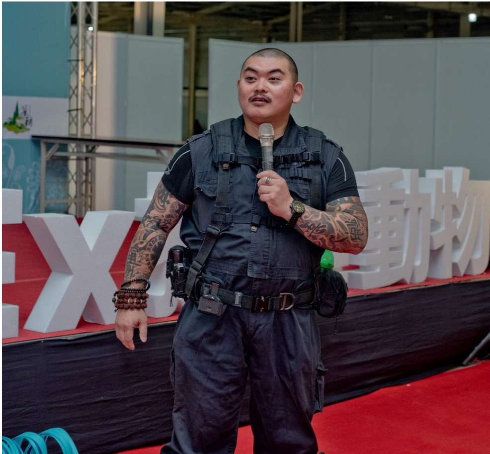
全副武裝的火山哥。