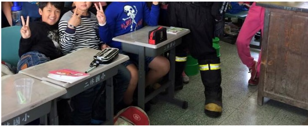
到國小演講，傳播教育理念。

訪問要結束前，火山哥用幽默但正經的口吻對我說：「我現在的工作，是照顧善良的人與動物，並對付壞人。你要記得保持一顆善良的心，不然等到你哪天變成壞人，我火山哥就會來對付你了。」