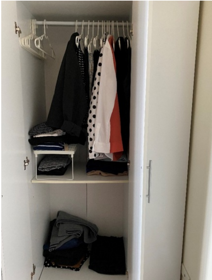
NanaQ的膠囊衣櫃。

對此，她提出了「膠囊衣櫃」的概念。膠囊衣櫃是將衣櫃裡的衣服數量維持固定（通常為 40 件左右），而這些衣服都是自己最喜歡且最適合的。若之後捨棄舊衣服或買進新衣服時，衣櫃裡的衣服數量都要維持不變。膠囊衣櫃不僅能減輕快時尚為環境帶來的巨大威脅，對於消費者來說，因為需要掌控衣服的數量，衣櫃裡的衣服絕對會是自己最滿意的，這樣不但能越來越了解自己的穿搭風格，也能減少搭配衣服的時間。