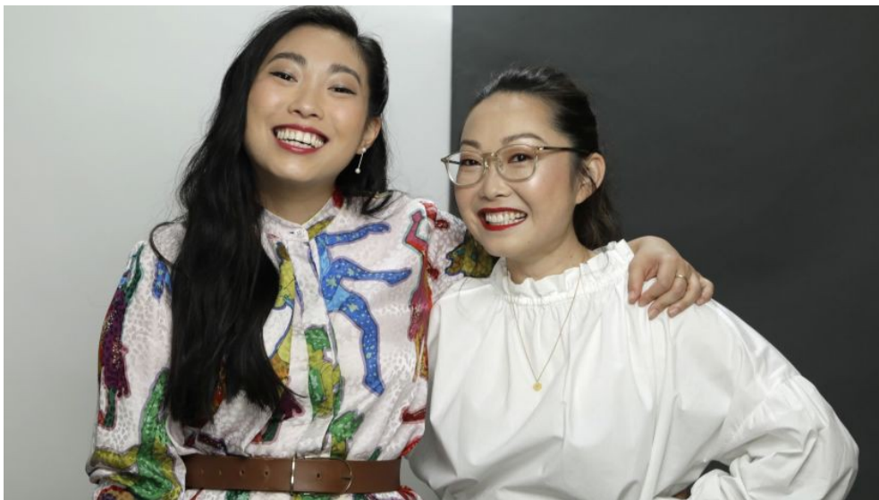
由左至右為女主角奧卡菲娜及導演王子逸。

除了面對死亡的不同，片中也輕描淡寫了幾個東西方文化的差異，像是表達情緒時的隱晦。當奶奶問比莉有沒有男朋友時，是用了「特別的朋友」這個詞。以及奶奶總是抱怨她後來找的老伴李爺爺，嘴巴上說不喜歡，嫌他又老又聾，但還是很照顧他、需要他的陪伴。家人中只有在對待比莉時，才會很直接的表達對她的愛及關心。這些也都是身為亞裔的導演王子逸（Lulu Wang），在東西方文化拉鋸中細心觀察的呈現。