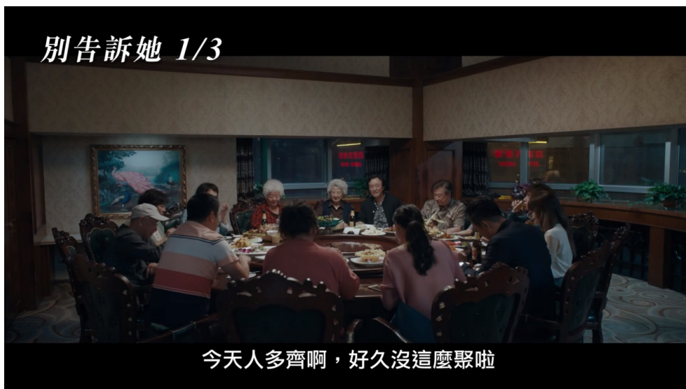
家族迎來久違的聚餐。

電影裡有許多畫面經常在生活中上演，像是家庭聚餐時，即使大家的心情很沉重，還是不忘比較自己兒女的成就。他們過去的心結與不愉快仍存在，硬拼湊的對話讓餐桌上氣氛十分尷尬。以及在電影的最後奶奶送別比莉一家，向他們不停地揮手直到看不見車影，接著腿一軟開始掩面哭泣，這樣的場面也令人覺得似曾相識。