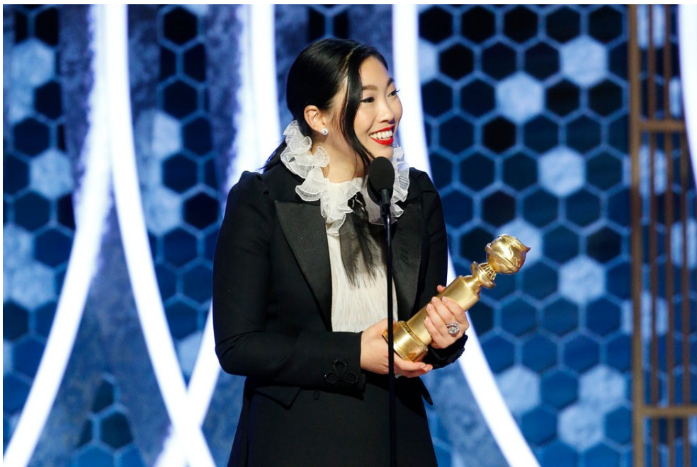
奧卡菲娜是金球獎首位亞裔影后。

《別告訴她》( The Farewell ) 於今年的1月3日在台灣上映，這部電影在2020年獲得了獨立精神獎 ( Independent Spirit Awards ) 的最佳劇情片。奧卡菲娜 ( Awkwafina ) 是飾演此片的女主角，拿下了金球獎的最佳音樂及喜劇類女主角獎，同時她也是首位獲得此獎項的亞裔女演員。這部電影與2018年上映的《瘋狂亞洲富豪》( Crazy Rich Asians ) 出演者皆為亞裔，也同樣展現了中西方文化的差異及衝突。