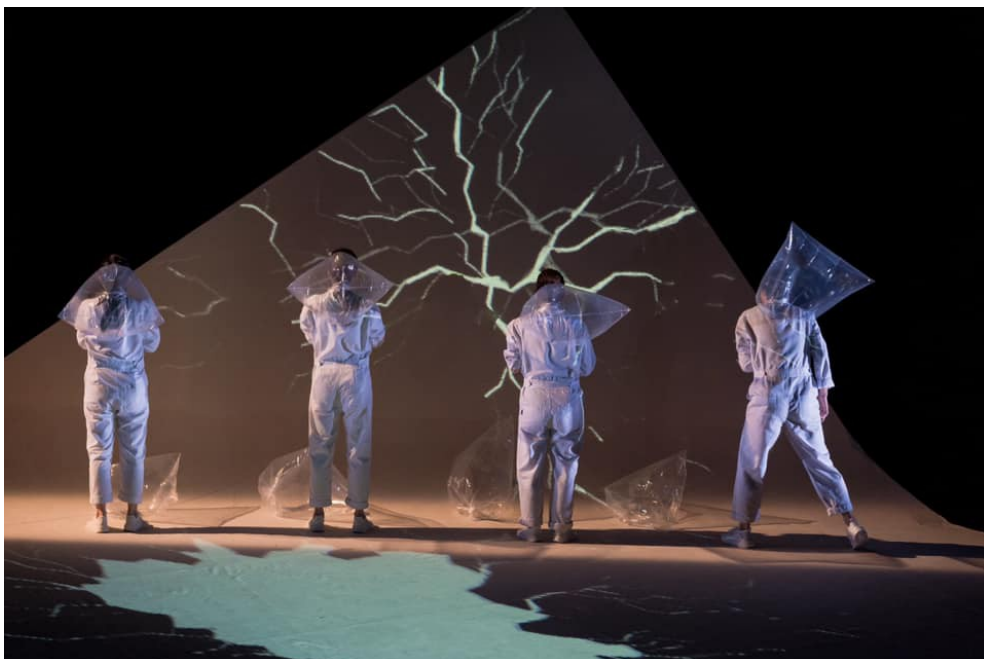
用塑膠袋呈現童話故事裡那位女人的翅膀。

故事的開始到結束，以一童話故事穿插比喻：「一位『駝背的女孩』如何成為『有翅膀的女人』」。並以此童話故事開場，貼合《最美的一天》的故事主軸。而這童話故事隨著主線故事的發展，用投影的方式慢慢訴說給觀眾聽。