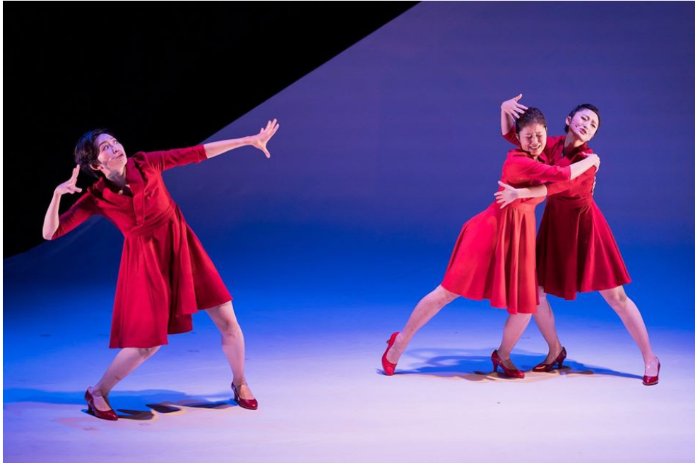
充滿活力的新手媽媽。

主線故事開始時，舞臺上有三位飾演媽媽的演員，她們不但是劇中的母親，更代表了全天下的母親。透過這樣的手法，可以呈現初為人母的手忙腳亂，忙碌的身影佈滿家中每個角落。以如此熱鬧的氛圍揭開《最美的一天》這齣音樂劇。