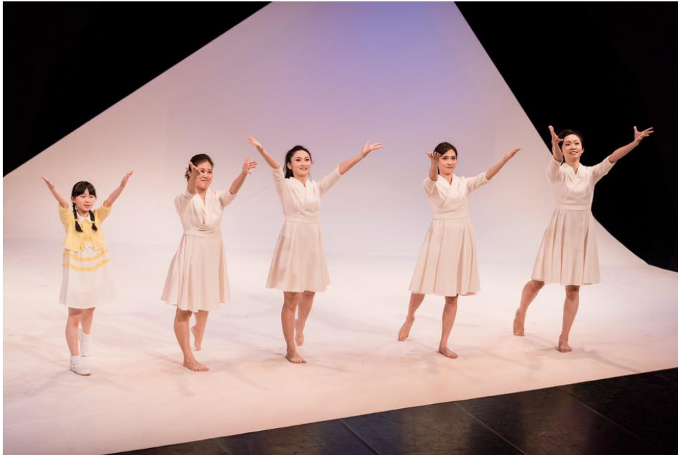
《最美的一天》中演員全是女性。