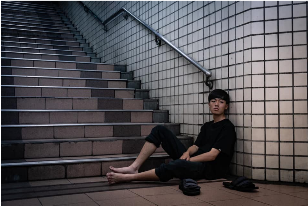
《街頭求生》，世上沒有真的感同身受。