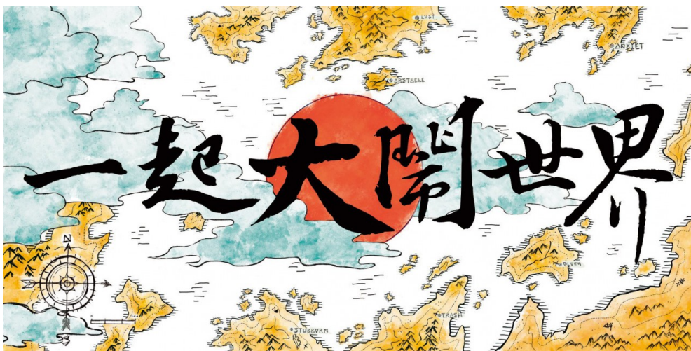
偉大航道啟航，一起大鬧世界！

創業一年半，第一階段「啟程」所設定的目標已經完成。子竣表示《想像世界》是第一階段的尾聲，接下來「SALU」將進入「偉大航道」，做出改變，整合創業、創作和公益，期待創造實際的衝擊。《傻子創業》將真實呈現下一場冒險，在鼓勵並且幫助青年勇敢追夢的同時，也希望實質的改善弱勢的情況。「想看一下一個小屁孩稍微想到的商業模式，到底可不可以社會中生存下去。」