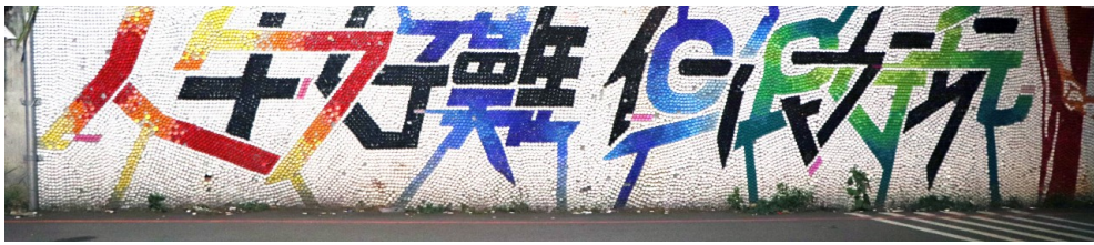
十萬個瓶蓋拼湊成沙鹿夢想街的新打卡景點。

子竣自稱自己是個有潔癖的人，他不希望影片中所呈現的東西有假的或是演出來的，但是「創作跟真實體驗需要作出取捨」。就好比《傻子走路》系列影片中他喊出來的那聲髒話，那份沒辦法繼續走完的不甘心是真的，但是那聲髒話是假的。當下的情緒很真實，但是要怎麼讓其他人感受到這份情緒的力道，就是身為創作者的他需要思考的地方。