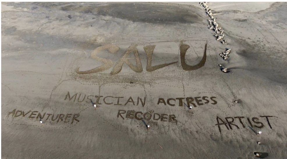
我們都有一個愚蠢的夢想，現在就開始勇敢的追吧。

「現在的狀態就是我們把目標訂在月球」這是子竣給予「SALU」目前的定位，聽起來可能不切實際甚至遙不可及，但是卻發人深省。「我們把目標訂得很高很高，不知道真的能不能達到，就好像訂在月球上，即便失敗了，我們依然能夠躺在一片星空下。」不限縮自己的格局，不停地冒險，就像影片裡常常講的那一句「SALU, keep it cool」。