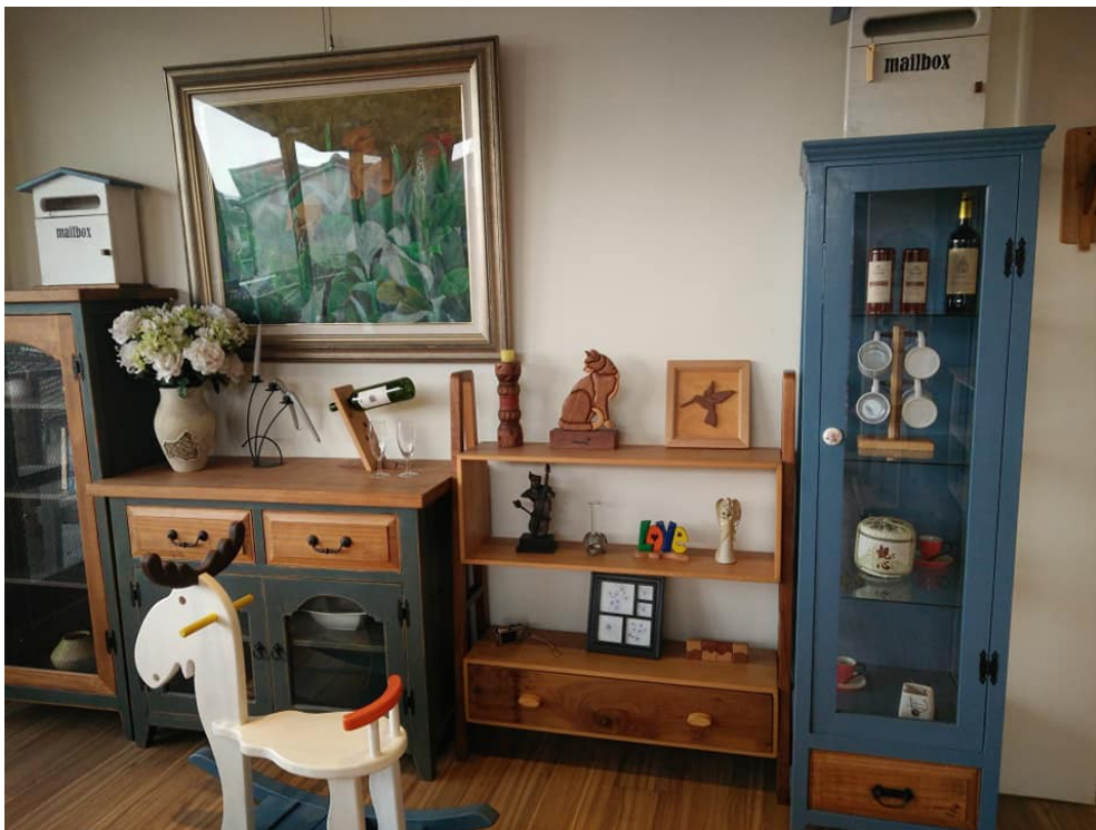
大衛工房的藝術創作作品，皆出自邱福源的巧手。

在彰化縣二水鄉的小巷裡隱藏著一間設計典雅、富有獨特藝術風味的「大衛工房」。不少路人都會被這間工房獨特的木造外觀所吸引並駐足拍照留念。這間工房的主人邱福源曾經在郵局服務，在上班之餘，也投注了很多心血和時間在自己最感興趣的繪畫上，並產出很多令人歎為觀止的藝術作品。幾年前，他為了個人的理想提早退休，遠赴太太的故鄉——中國桂林，開設一棟雅致的旅館。此旅館結合了他的藝術創作並獲得當地遊客的好評，在得到一筆不錯的收益之後，他回到台灣的二水老家，開啟了他夢寐以求的藝術創作天地——大衛工房。