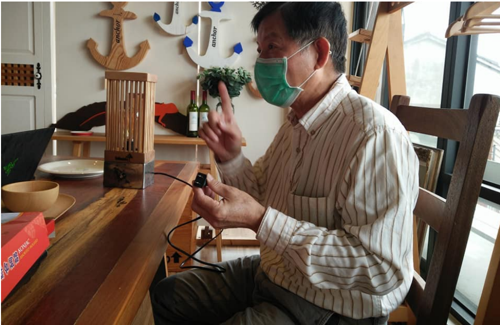
生活中的任何小物品都可以融入藝術的元素。