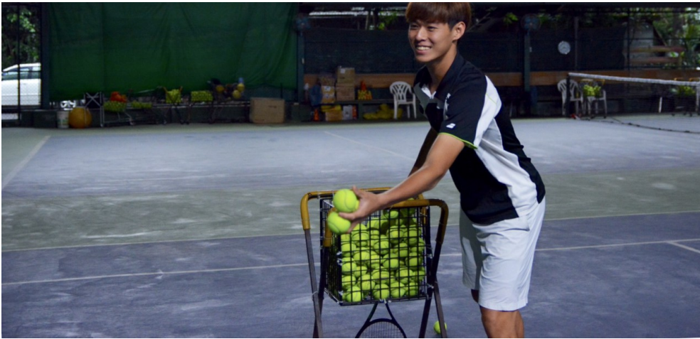
熱愛教球的他，時常掛著笑容。