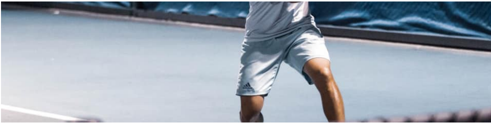
比賽時全神貫注的鄭國亨。