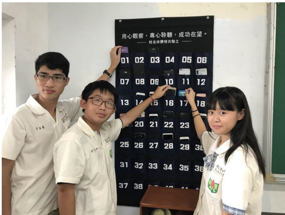
高中教室設有手機置放袋，讓學生上課不滑手機。