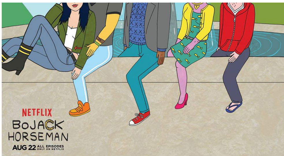
《馬男波傑克》中的主要角色，由左至右為黛安、花生醬先生、波傑克、凱瑟琳公主、陶德。

劇中有許多荒誕不稽的內容，會發生許多在現實生活中絕對違反邏輯的事件，因此在剛開始觀看時，常會令人有著一絲難以咀嚼下嚥的違和感。然而在逐漸習慣劇情節奏後，觀眾便能夠發現到這部影集的深度。重點並不在於表面發生的情節，而是劇中角色在對話的同時，彷彿將觀眾最赤裸、最真實的自我暴露出來。那些經典的對白都深深的印在觀眾的內心深處，激發出許多反省與悲傷。