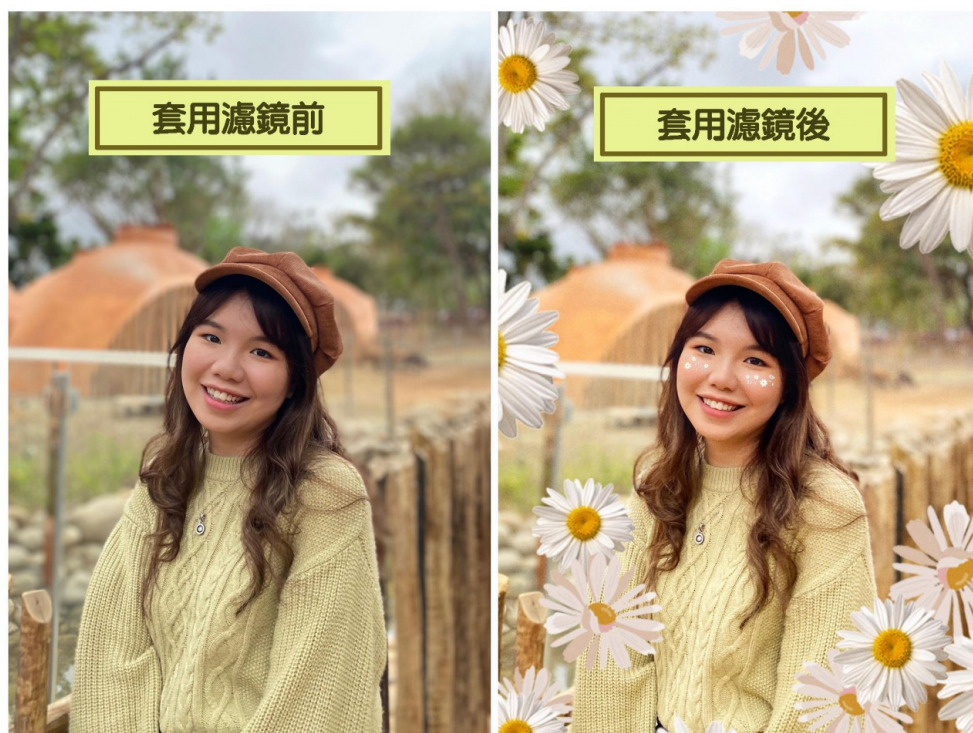
原版照片和有使用濾鏡照片的差別。