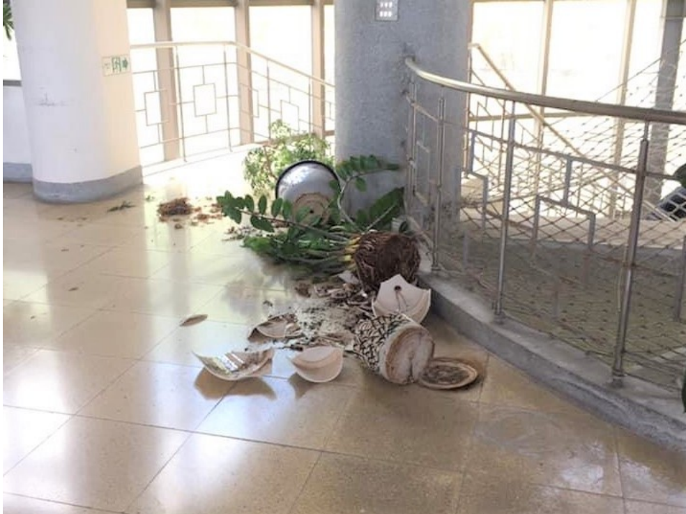
學校擺設經常遭獼猴破壞。

中山大学因建地夾獼猴的活動範圍至廣，時常能見到獼猴在校園裡。就讀中山大學的學生何婕瑜表示，學生們時常受到獼猴的干擾，辛苦做出的作品會被破壞，甚至有時還需要清理臭掉的排泄物。獼猴數量極多的中山大學，做出了一些對應的方針。中山大學在入學時的新生訓練時會進行獼猴相關宣導，教導學生如何與獼猴和平共處。但因為無法管制當地遊客，所以成果有限。