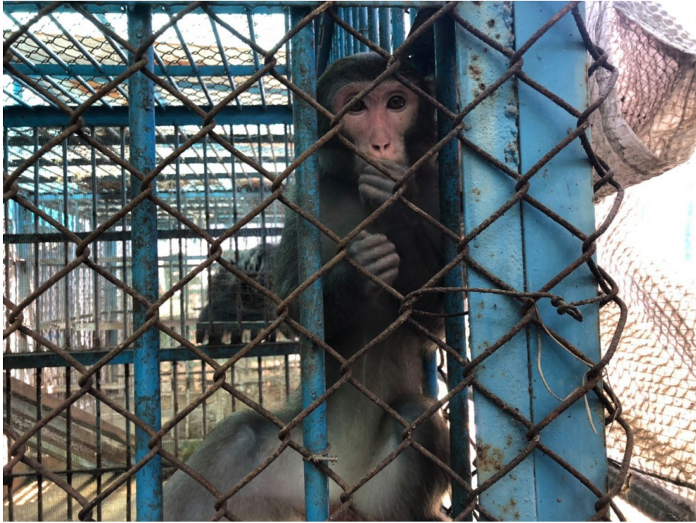
獼猴私養及販賣問題層出不窮。