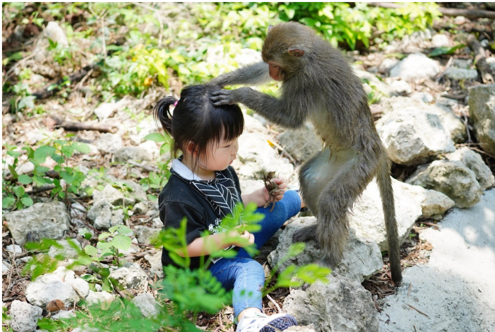
獼猴理毛是一種友善的互動行為。

是台灣獼猴侵占土地，搶奪人類的食物嗎？其實就這片土地的「主人」來說，獼猴當然比人類早先生存在這片土地。不過人類也需要生產，需要開發土地以維持生活。黃聿訢說：「我們也不用去追究是野生動物還是農民的錯，而是去思考該如何解決衝突。」爭論無法解決問題，既然同住在台灣這個島嶼上，人與獼猴之間的衝突必然不會結束。只要好好的去了解牠們，就能找到我們相處的一個平衡點。