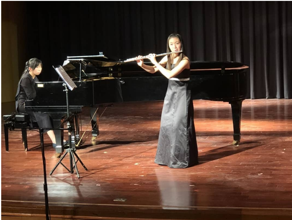
音樂班學生在台上表演。

從學習古典樂、進入音樂班，到就讀音樂系，很多人是朝著成為演奏家的最終目標不斷奔跑著。然而成為演奏家除了要自身天賦以及刻苦的努力，還需要足夠的金錢援助。另外，台灣的古典樂市場受到網路媒體以及閱聽人喜好改變等外部因素影響，能獲利的程度有限，面對僧多粥少的演奏圈，不少人選擇將自己的舞台移到教職，國立清華大學學生葉家榆就說：「我會前往國外繼續進修，並同時以任教跟伴奏成為握的副業，這樣能有比較穩定的收入來源。」