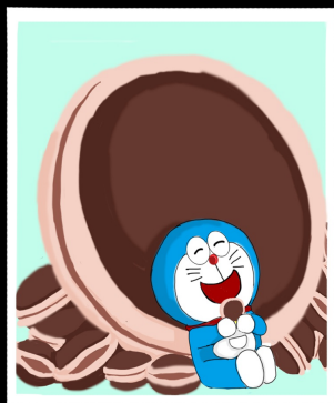
二次創作 (EX.哆啦A夢仿畫)