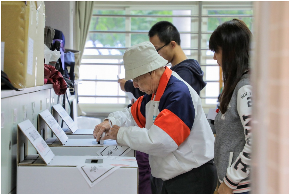
臺灣的公民具有選舉的權利。

涂峻清更進一步說明，《民法》是20世紀初參照歐陸法系的國家如日本、德國所訂定出來的，但是德國和日本都已經下修民法成年年齡。而台灣也是亞洲唯一成年年齡仍在20歲的民主國家。