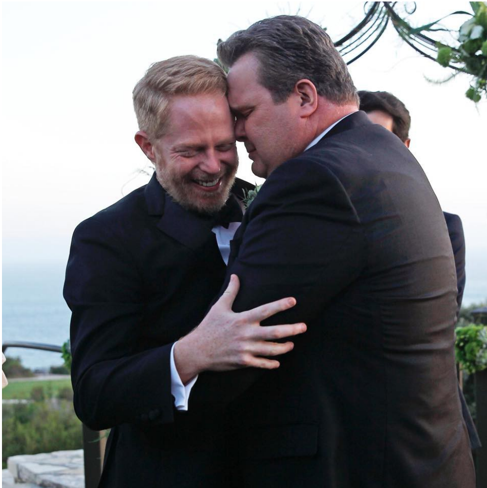
2015年美國全境同性婚姻合法化，劇中米契與卡麥隆也完成婚禮。

像是同性伴侶米契與卡麥隆，他們面對外界少數批評的眼光，通常是尷尬的一笑帶過，或是用自嘲的方式回應，並不會正面與人起衝突。他們也被塑造成「不積極參與同志活動」的同志，更解釋了他們在面對不友善時溫和的行為。此外，雖然傑是米契的父親，但他一直無法真正接受米契的性向，在劇中多以半開玩笑的嘲諷取代直接的爭吵，以表現傑與米契之間些微緊張的關係。這樣的劇情讓挺同的觀眾不至於因為傑的偏見而討厭他，也能夠得到那些跟傑一樣不太能接受孩子性向的父母的理解。