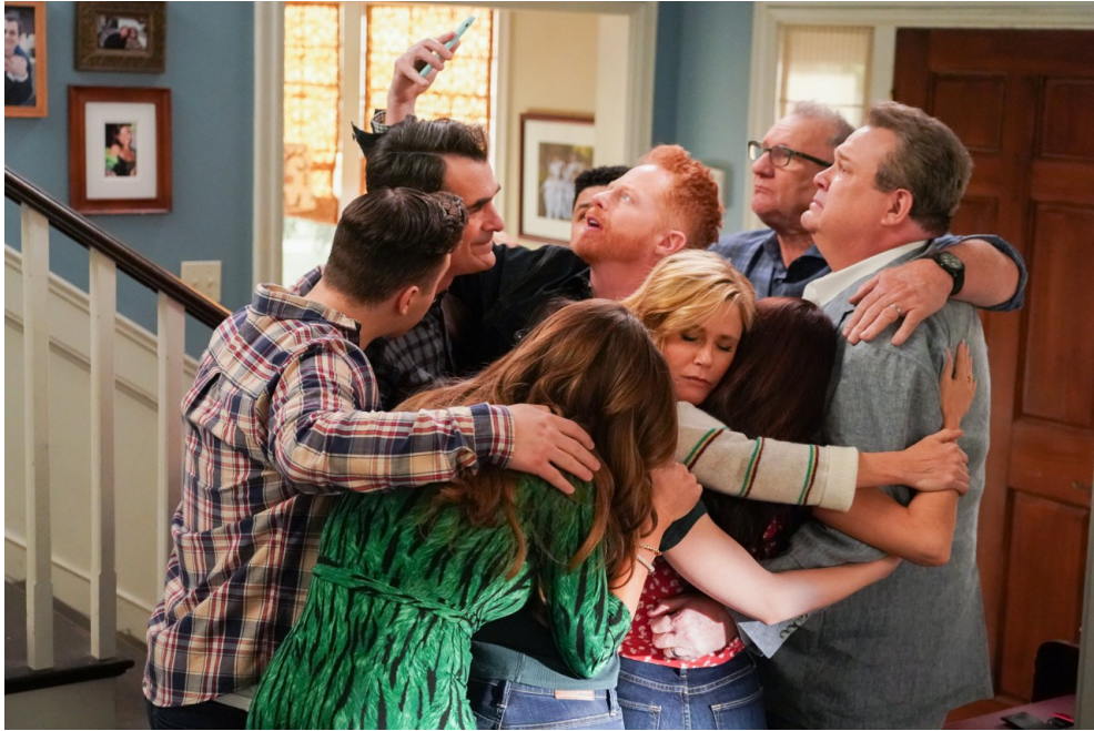
米契與卡麥隆搬家前，與家人擁抱道別。

《摩登家庭》描繪了一個家族的成長，到了最後一季，每個角色都將往美好的前途各自邁進。這對他們來說才是最重大的挑戰，因為他們早已習慣有彼此的陪伴，無論悲傷與喜悅，總是有家人作為最堅強的後盾。但是，在那個未知的將來，他們並不懼怕，因為有了愛之後，他們會更加勇敢。