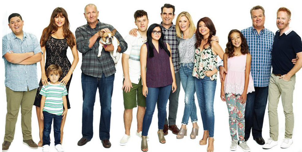
《摩登家庭》官方宣傳照。