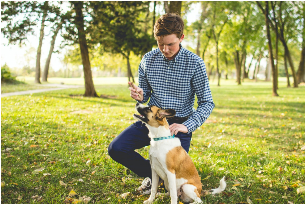
青春期的狗狗更容易抗拒主人的命令。

研究發現，8個月大的狗花了更長的時間來回應「坐下」的指令，即使過往的牠們都明白且遵從這項指令。此外，研究團隊也對285位狗飼主發放問卷調查，問卷結果也和研究的預想相符：進入青春期的狗狗確實比較難服從與訓練。