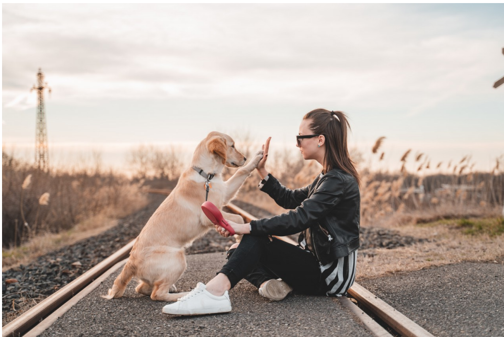
不安全的環境與壓力下，人類和狗狗都會提早進入青春期。( 圖片來源 / unsplash )

結果顯示，符合不安全依戀關係 ( 分數較高 ) 的小狗進入青春期的時間會更早 ( 約在5個月時 )，而分數低的小狗一般會在8個月時進入青春期。與飼主關係不佳的小狗在壓力下會提早進入青春期，如同與父母關係不好的少女也會更早進入青春期。此外，那些會因為與飼主分離而感到焦慮的狗狗們，在青春期也表現出愈來愈不服從飼主命令的情況。這也驗證了親子、飼主與狗狗兩段關係的相似點。