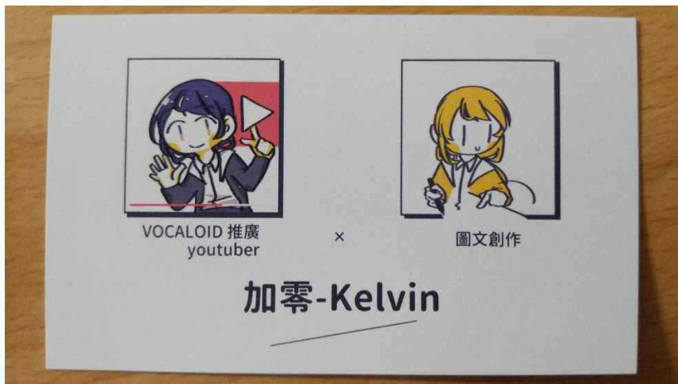
加零名片上的不同形象表現。

拿出名片自我介紹的加零，名片中一邊是黑髮黑眼的YouTube頻道形象，另一邊則是黃色頭髮的圖文創作形象，兩張圖雖呈現不同樣貌，卻也同時是眼前靦腆微笑的短髮女生。