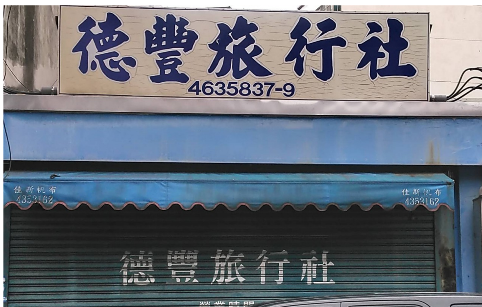
德豐旅行社的外觀。

然而，即便與其他旅遊業者合作共贏，大部分的旅行社們仍舊得勒緊褲腰帶過活，而原因在劉利樹看來十分簡單。他說過去有九成的旅行社是主營國外旅遊的，「雖然說因為疫情的關係很多旅行社都說要轉換成做國內的，但根據我們行業內的雜誌《旅報》所說，依舊有大約七成的旅行社沒有轉換跑道。」他緊接著以自家旅行社做舉例，由於他們的旅行社規模較小，因此從沒進行過與國內旅遊相關的業務。因此在疫情爆發後收入頓時驟減，然而日常的支出並沒隨著疫情而減少，即便政府對於主營國外旅遊的旅行社有些許補貼，他們也沒有餘力去開發國內景點路線、重新接觸國內的合作業者，只能維持著當前的營運模式並期待疫情能於一兩年內迅速結束。