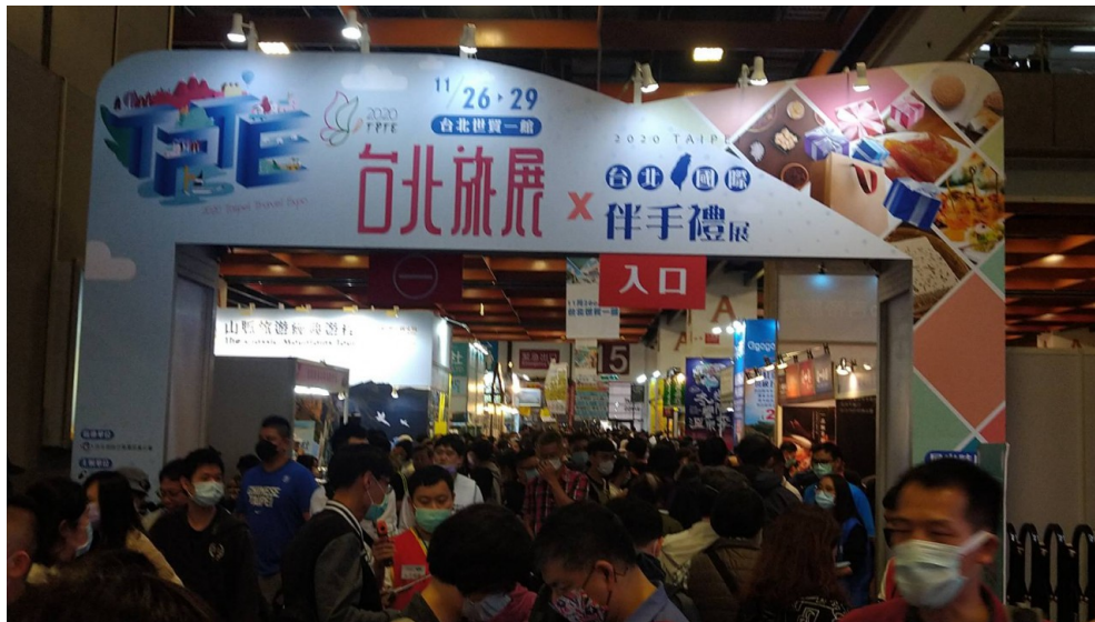
旅展出入口前，人流湧動的景象。

一年一度的TPTE台北旅展在十一月二十六日於台北世貿一館正式開幕，然而本次展覽原定為今年二月二十一日舉辦，由於疫情影響而被迫延期。不僅如此，在規模亦或是人流方面，本次展覽與往年相比都大幅縮水。此外，旅行社不堪負荷被迫裁員甚至是倒閉的消息也不時傳出。究竟在這場全球疫情中，我國的旅行業面臨著哪些困境呢？就讓記者帶您來一探究竟吧！