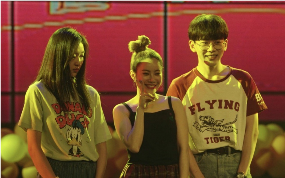
劇中還原徐懷鈺的歌友會，並由徐懷鈺本人客串演出。

由於本劇的背景設定為穿越回1998年，因此製作方花費了許多心思還原二十世紀末的置景、服化道（服裝、化妝和道具）、美術、配樂等。其中包括了老式收音機、卡帶與光碟機的出現，唱片行張貼著小虎隊、劉德華的海報和張國榮的CD，故事情節中更是有電影《鐵達尼號》的上映、郭富城髮型的風潮、足球世界盃巴西隊爆冷等，這些細節為整部劇烘托出復古、懷舊的氛圍，增加了觀眾的沉浸感。