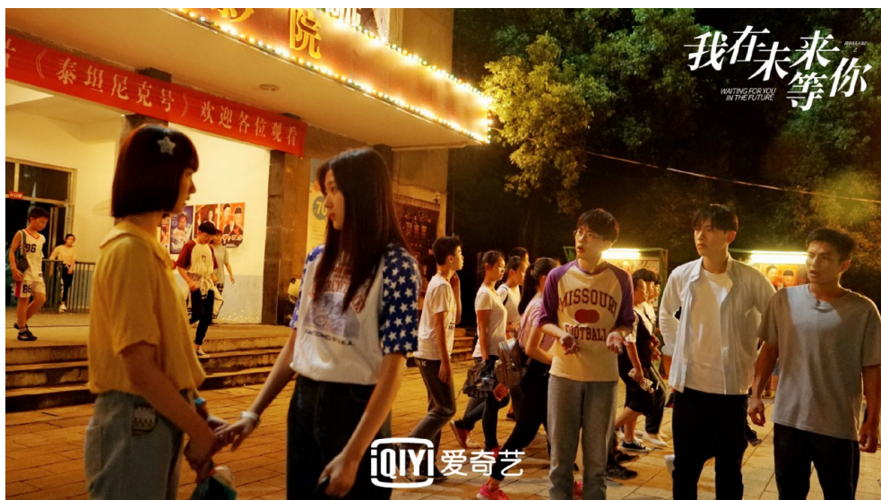
《我在未來等你》中還原電影《鐵達尼號》上映的場景。

作為主角，大志的角色性格和成長背景能夠引起許多觀眾的共鳴：生於並不富裕、卻也毋須煩惱生計的家庭，有一個經常加班、鮮少陪伴自己的爸爸，還有一個總嫌自己不夠好、要多向其他朋友學習的媽媽。他有著許多自以為是的小聰明、會用笨拙的方式吸引喜歡的女生注意，也會早上起不來、上課打瞌睡。這些平凡的成長歷程、生活細節，讓觀眾更容易感受劇情的起伏，能夠與大志一同經歷他的故事、與他一起成長。