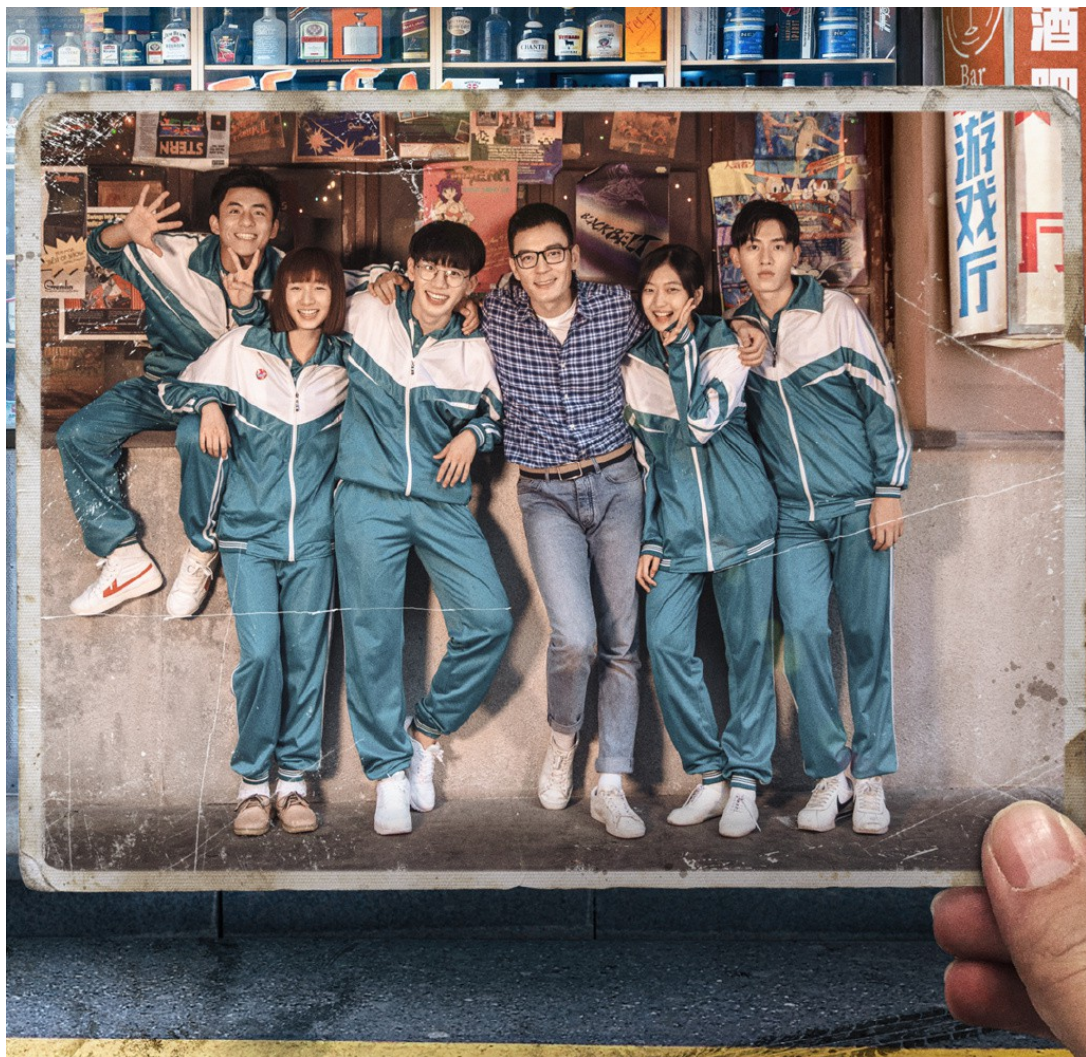
《我在未來等你》故事圍繞著作為班導師的男主角與五位學生。