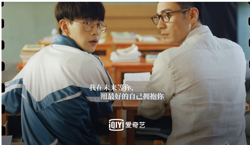
費啟鳴飾演的劉大志（左）與李光潔飾演的郝回歸（右）。