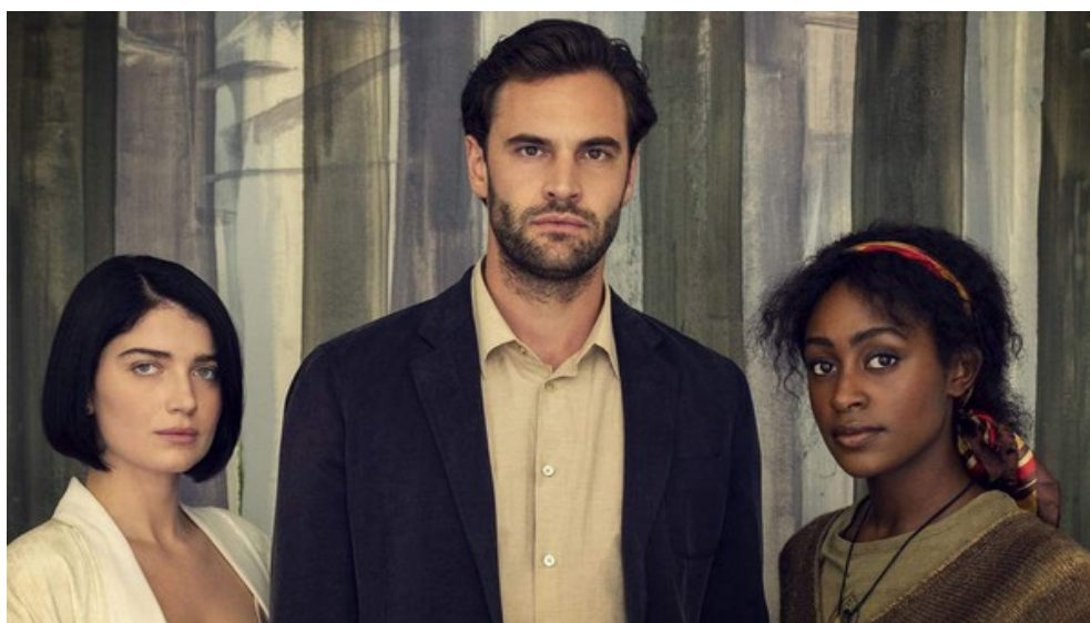
從左至右分別為愛黛兒、大衛與露易絲。

《三人要守密，兩人得死去》由依芙·霍森 (Eve Hewson)、席蒙娜·布朗 (Simona Brown) 及湯姆·巴特曼 (Tom Bateman) 領銜主演，改編自莎拉·平柏羅 (Sarah Pinborough) 於2018年出版的同名小說，為一季六集的心理驚悚短篇影集。