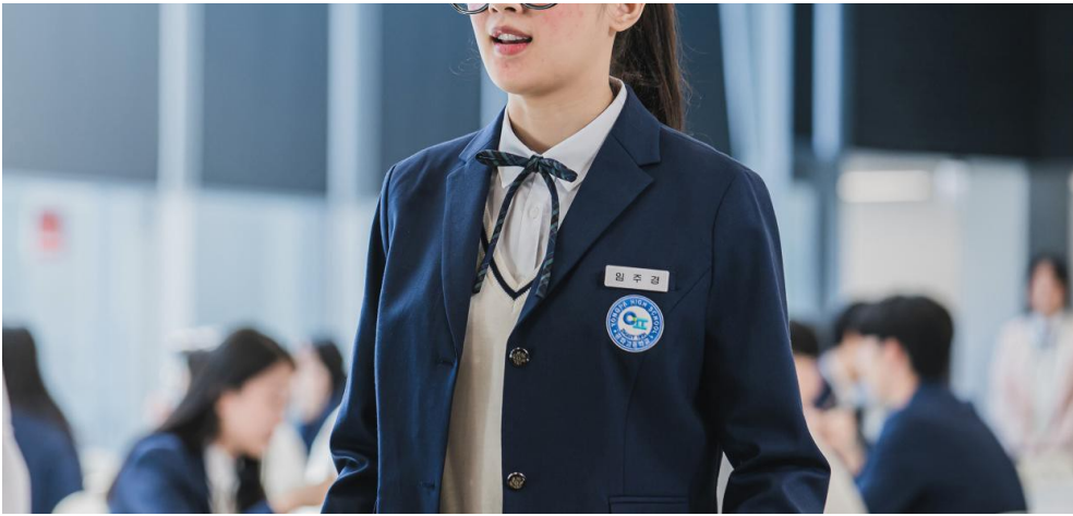
朱靜在劇中的素顏模樣。

遭到校園霸凌的朱靜，恐怕不只是個案。2021這年，許多韓國藝人涉嫌校園霸凌事件，其中包含數名當紅團體成員及知名演員。即使這些爆料並非全部屬實，校園霸凌仍是韓國長期以來倍受關注的議題，更是多部戲劇跟電影的取材主題。網路上也發起校園霸凌版的「Me Too」運動，熱潮從體育界延燒到演藝圈，受害者紛紛發聲，講述他們在學生時期經歷的悲慘際遇，可見校園霸凌在韓國已非一朝一夕之事。