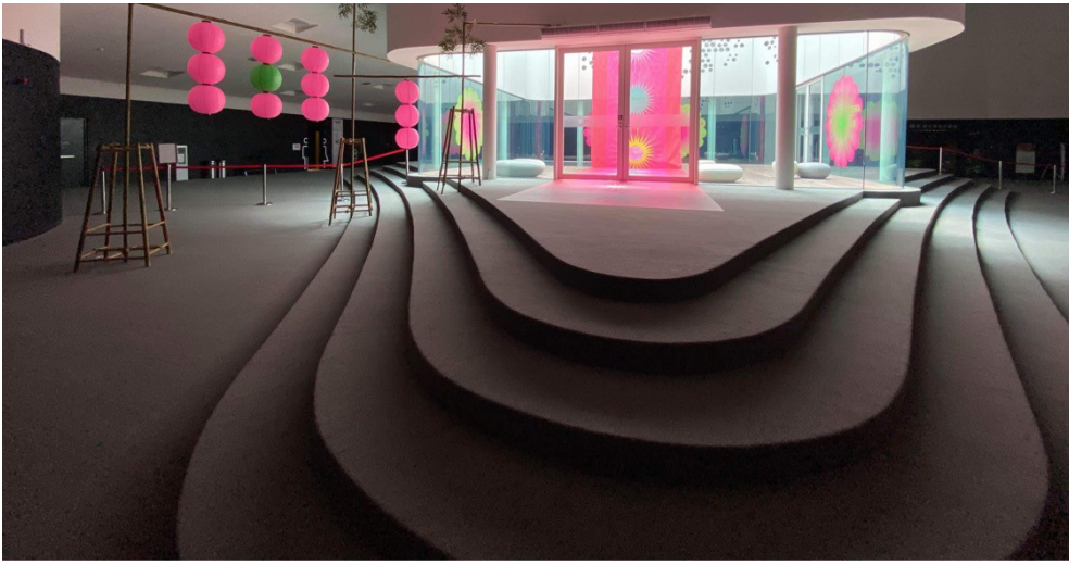
《EUREKA!2.0發現衛武營》中《抬轎》的展覽空間設計中已可見深夜放電所元素。