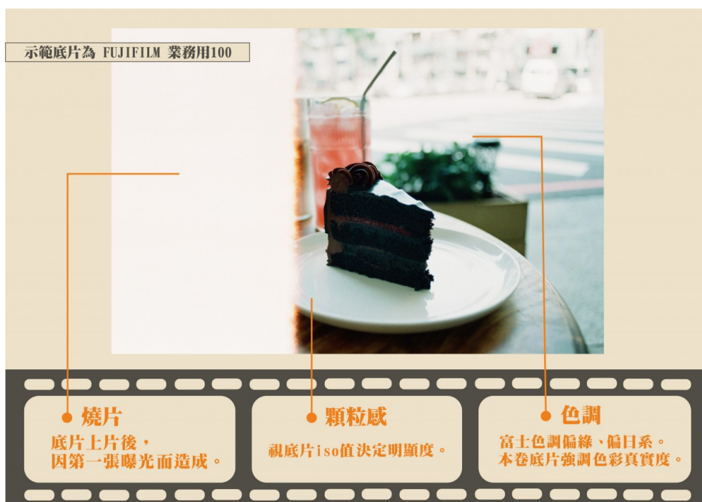
底片的特殊成像。

「我覺得底片的迷人之處，就是那種無法預期的感覺吧。」即便經常使用數位相機，陳昱瑞仍能輕易點出底片相機扣人心弦之處。除了底片本身的色調和拍攝、沖洗之間的時間差，在拍攝中遇到的各種「意外」，例如裝底片時因為曝光所造成的燒片，或是因為光線調控不佳所造成的特殊光感，都成為沖洗底片時的驚喜。這些不經意的意外，使得底片在數位時代的衝擊下，仍然獲得部分人們的喜愛。