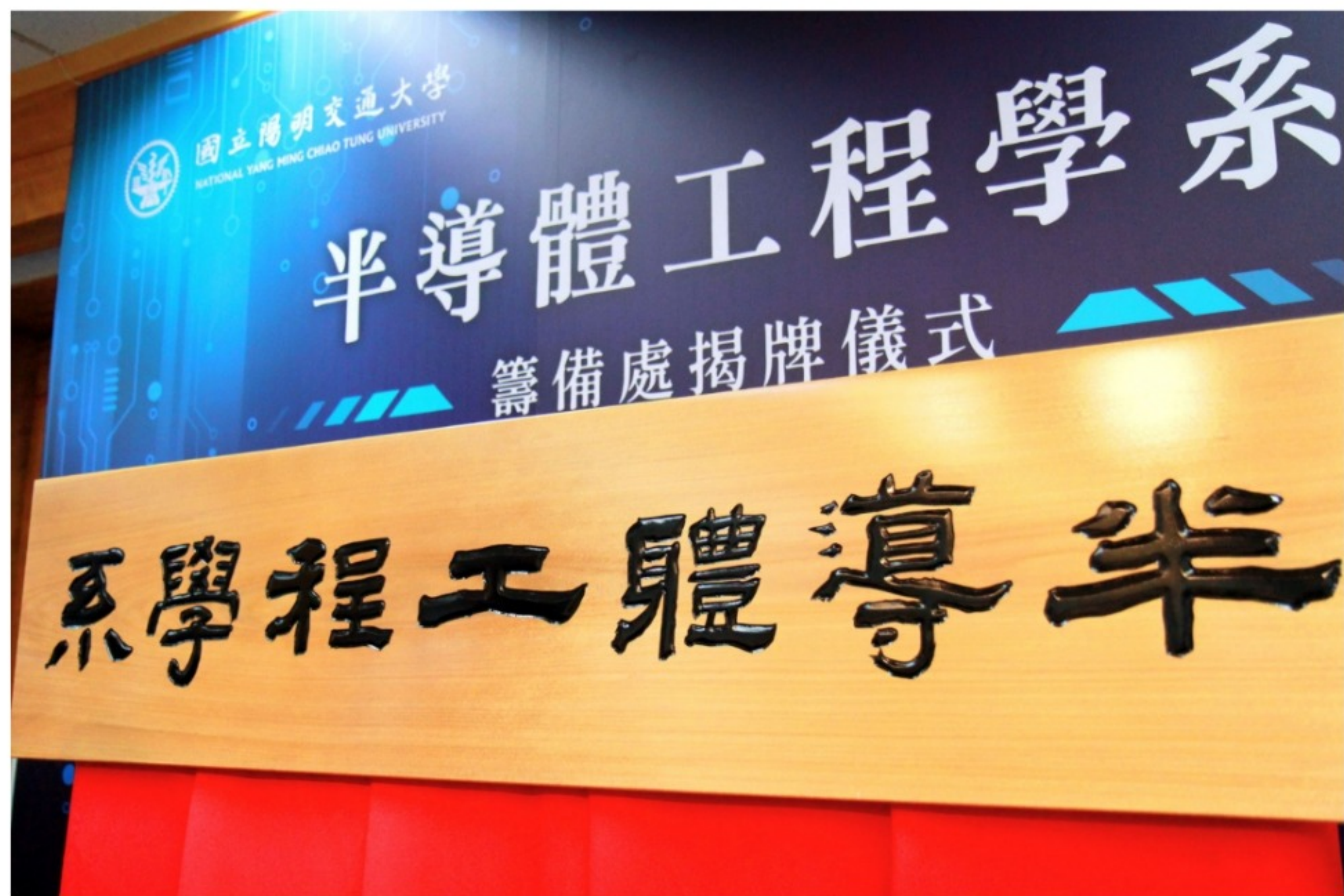
半導體工程學系籌備處正式成立

半導體工程學系籌備處8月10日正式成立，未來將和企業界緊密合作，共同訂定教學目標和方向，並提供實習及出國交換學生機會，期待為高等教育及產業交出亮眼成績單。