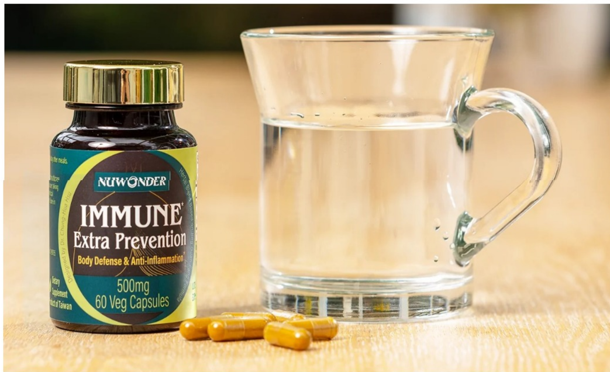
淨冠方在美上市

陽明交大促進中醫教研及產業發展，由傳統醫藥研究所研發的中藥方劑「淨冠方」(美國商品名 Immune Extra Prevention)，日前在國內生技藥廠順天堂的合作下，正式於美國電商巨擘 Amazon 上架。