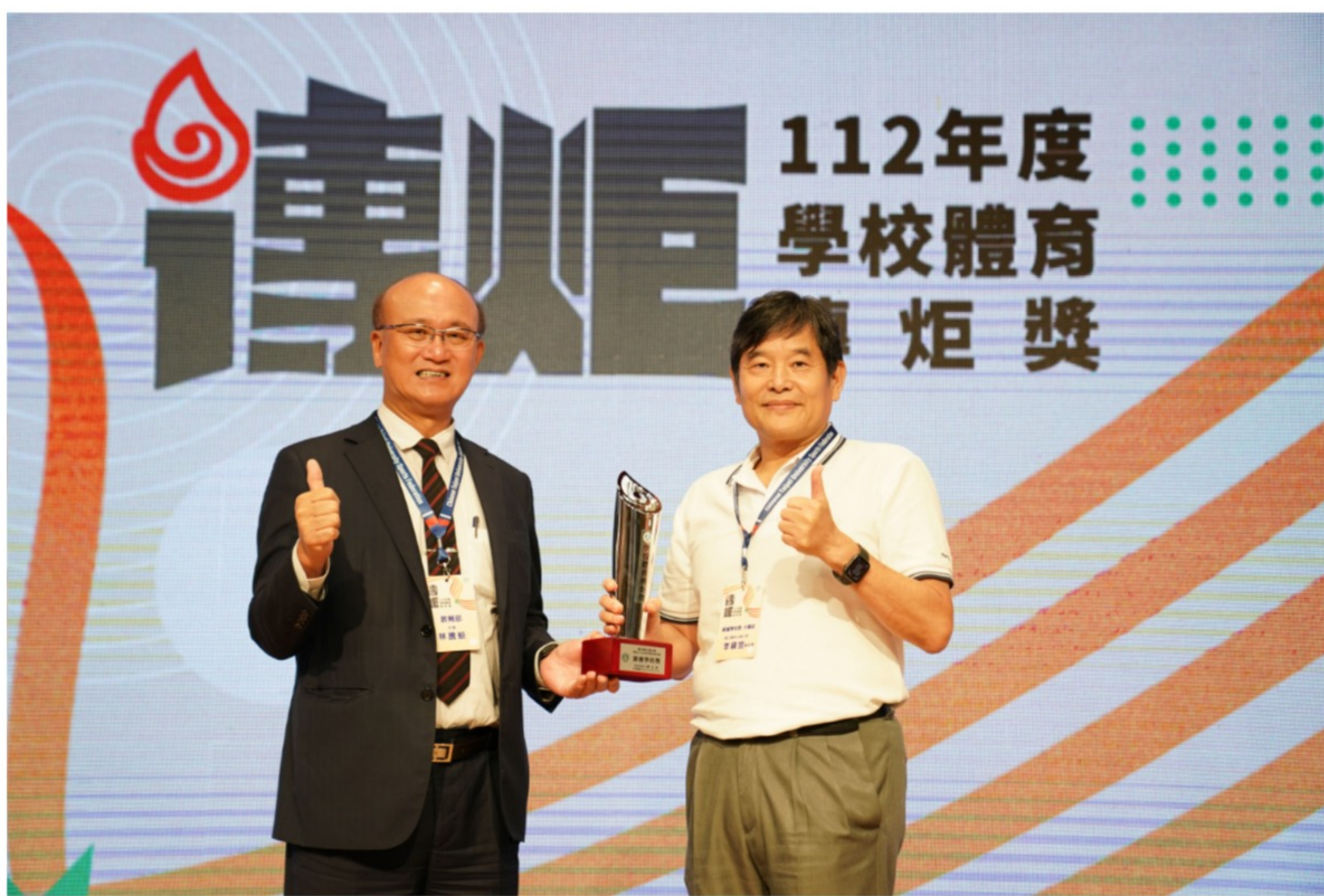
本校榮獲「112年度教育部體育署學校體育傳炬獎」大專組績優學校獎

在校方的推動以及全校師生共同努力下，教育部體育署日前公布「112年度教育部體育署學校體育傳炬獎」獲獎名單，本校榮獲大專組績優學校獎。