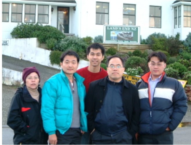
2003 年和學生到紐西蘭但尼丁參加 第 19 屆國際生物力學學會研討會

在上海讀書的學生很多都來自外地，返鄉不便的情況下，每天都留在學校讀書、做研究，那種急於掙脫貧困，渴望出人頭地的意念讓人動容，也促使大陸的學子迅速地累積實力；反觀台灣的學生受環境的誘惑太多，又不願吃苦，研究動機、熱忱和努力程度都遜於彼岸，本土競爭力正一點一滴的流失。