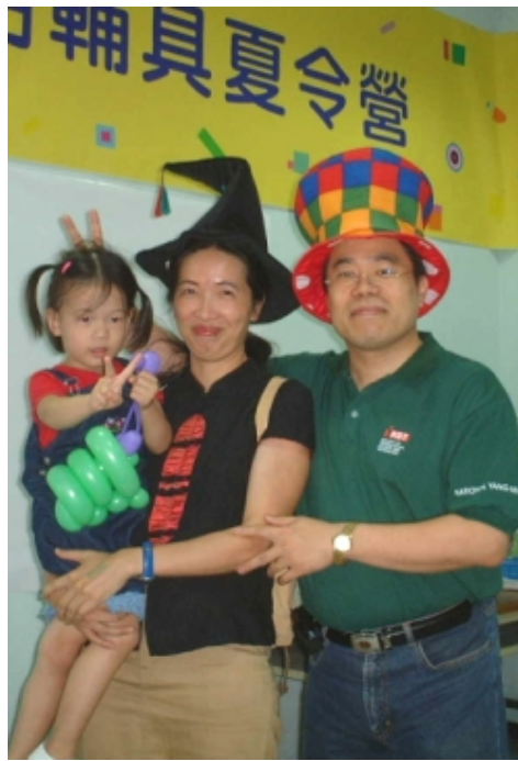
鄭老師到現在還是童心未泯

來陽明之前，我在台大骨科時常和同事約去打高爾夫球，對這種運動發生興趣也是基於觀察人體如何在瞬間發揮力量；來陽明之後，也就漸漸不打了。