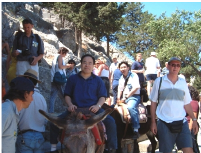
2001 年帶學生一起參加第 4 屆 聯合骨科研究學會年會 ( 會後神殿之旅 )

由於一歲時罹患了小兒麻痺，造成右腿萎縮，鄭老師自承平時因為行動不便，所以每次出遊都喜歡開車，「因為可以在很短的時間內去很多地方，看很多人。」鄭老師每到一個新環境最喜歡觀察當地人走路的姿勢，根據觀察推測這些人身體患有哪些疾病？是城市人或鄉村人？是中國人或日本人？這些都是隨處可取的活教材。