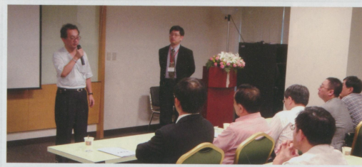
●開會氣氛溫馨融洽