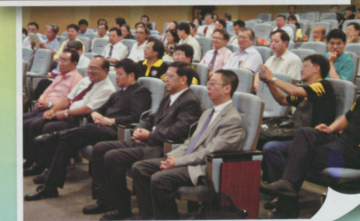
●四校聯合大會貴賓蒞臨