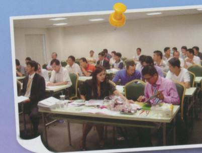
●陽明校友大會開始囉