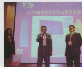
●抽到華碩筆電的是~