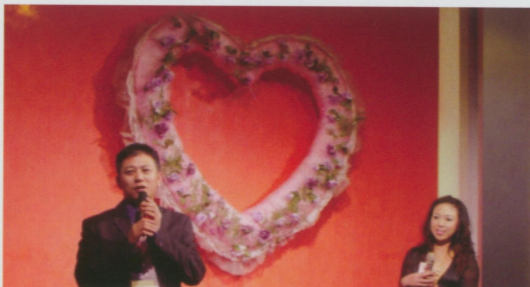
●北市分會鄭會長歡迎大家（這也不是「來電50」錄影現場！）