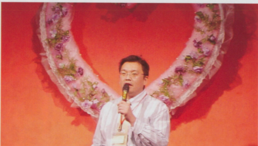
●北縣分會張會長感言（這真的不是結婚典禮新郎感言啦！）