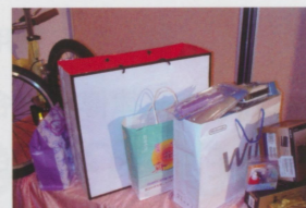
●準備抽獎囉！想抽到Wii嗎？