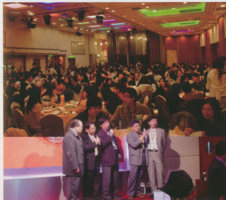
●北市陳理事長陪同來賓高歌一曲